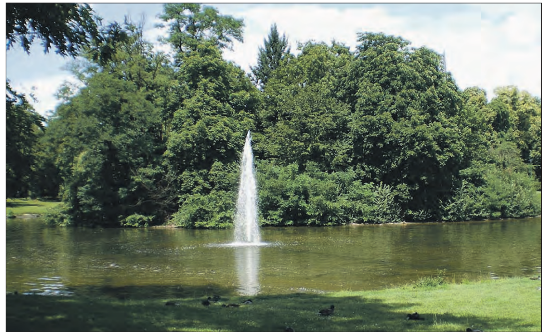
DIE TEICHANLAGE IM HERRNGARTEN wurde umfangreich saniert.

Das alte Ablaufbauwerk des Teiches wurde abgerissen und durch ein modernes Bauwerk ersetzt. Hierbei – und parallel zur Sanierung des Kanals in der Frankfurter Straße – erhielt der