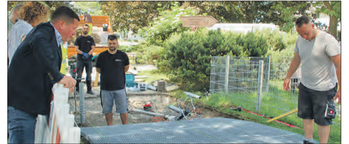
BÜRGERMEISTER ALEXANDER KREISSL (links) beim Vor-Ort-Termin an der neuen Wurzelbrücke im Villenave D'Ornon-Park.

Neue Wurzelbrücke im Villenave D'Ornon-Park