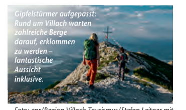
Foto: epr/Region Villach Tourismus/Stefan Leitner mit Unterstützung von Bund und Europäischer Union

Die Region Villach – Faaker See – Ossiacher See verspricht facettenreiche Glücksmomente für Groß und Klein (epr) Die perfekte Mischung aus Ruhe und gemeinsamen Erlebnissen in imposanter Natur wartet in Österreichs südlichstem Bundesland Kärnten. In der Region Villach – Faaker See – Ossiacher See, wo sich Berge, Täler und Seen aneinanderreihen, prägt die Natur jede Unternehmung. Ob Gipfelstürmer, Wasserratte, Radler oder „Ruhesucher“, die vielseitige Berg- und Seenlandschaft hält individuellen Urlaubsgenuss bereit. So laden bspw. der Faaker See oder der Ossiacher See zu Abkühlung oder Funsport-Action ein. Kleine Urlauber toben sich im Hochseilgarten aus, begeben sich auf spannende Erlebnisreisen oder verfolgen eine Adlershow. Wanderer steigen auf die Gipfel des Naturparks Dobratsch, der Gerlitzen Alpe oder des Mittagskogels. Auch Genusswanderer oder Radler kommen auf ihre Kosten: Rad- und Mountainbike-Routen am Fuße der Berge versprechen unvergessliche Naturmomente. Und unweit der italienischen Grenze lädt Villach jeden ein, seine Auszeit mit einer Prise „dolce vita“ zu versüßen. Mehr zum facettenreichen Urlaub unter www.reiseplaza.de/villach