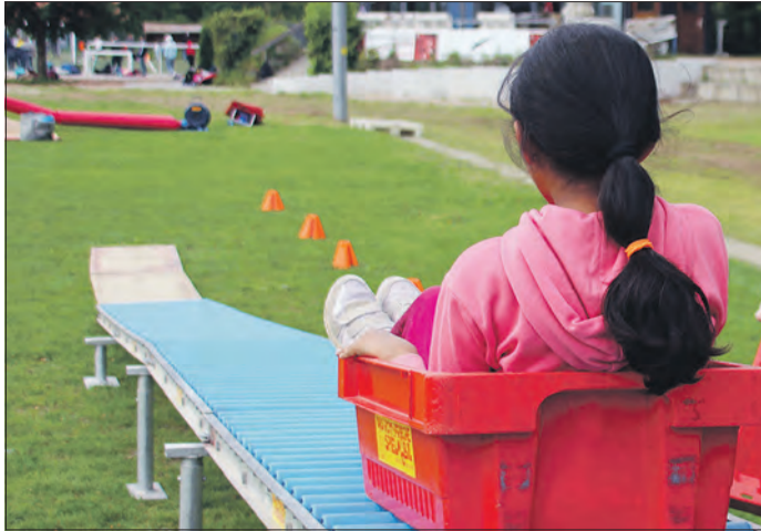
SPIEL UND SPASS HELFEN, sich besser kennenzulernen.