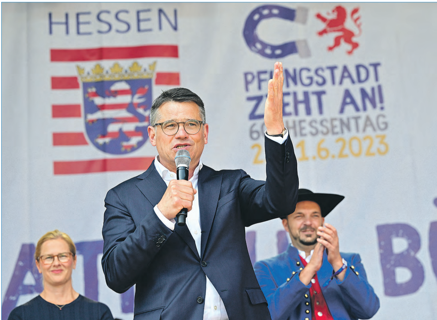
MINISTERPRÄSIDENT BORIS RHEIN hat den 60. Hessentag in Pfungstadt eröffnet.