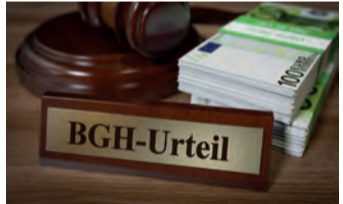
Starkes Urteil für Versicherte.

auch heute noch anfechtbar. Man nennt dies „ewiges Widerrufsrecht“. Bei einem Widerruf erhalten Sie – anders als bei der Kündigung – alle eingezahlten Beiträge ohne Abzug von Maklerprovisionen und Verwaltungskosten zurück. Und nicht nur das: Die Versicherung muss Ihnen eine sogenannte Nutzungsentschädigung dafür zahlen, dass Sie mit Ihrem Geld Gewinne erwirtschaftet hat. So können Sie im Idealfall bis zum Doppelten der eingezahlten Beiträge zurückerhalten. Ein sattes Plus auf Ihrem Konto winkt – in Zeiten hoher Inflation eine wirklich gute Nachricht!