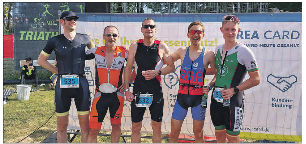
ZUFRIEDENE TRIATHLETEN der SGA.