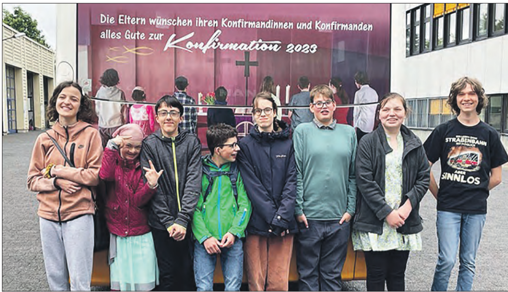
DIE KONFIS und ihr Bus.

Altar der Andreaskirche fährt als Foto durch die City