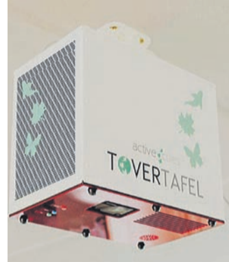
Die Tovertafel holt die Menschen aus ihrer mentalen

Isolation und lässt sie Glücksmomente, Spaß und Gemeinsamkeit erleben. Sie bietet eine Fülle von Spielen, die je nach dem Grad der Demenz individuell gewählt und eingesetzt werden können, von anregend bis beruhigend.