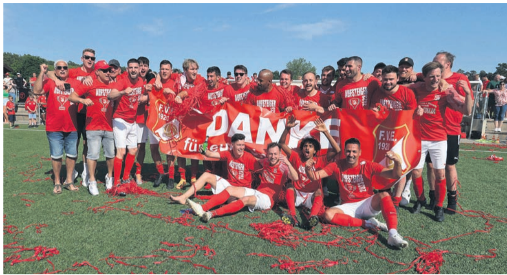
Die Freude über die Meisterschaft war beim FV Eppertshausen groß.