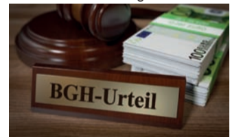
Starkes Urteil für Versicherte.

auch heute noch anfechtbar. Man nennt dies „ewiges Widerrufsrecht“. Bei einem Widerruf erhalten Sie – anders als bei der Kündigung – alle eingezahlten Beiträge ohne Abzug von Maklerprovisionen und Verwaltungskosten zurück. Und nicht nur das: Die Versicherung muss Ihnen eine sogenannte Nutzungsentschädigung dafür zahlen, dass Sie mit Ihrem Geld Gewinne erwirtschaftet hat. So können Sie im Idealfall bis zum Doppelten der eingezahlten Beiträge zurückerhalten. Ein sattes Plus auf Ihrem Konto winkt – in Zeiten hoher Inflation eine wirklich gute Nachricht!