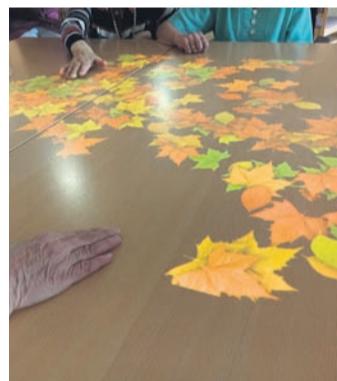
kognitiven Ressourcen stimuliert werden.