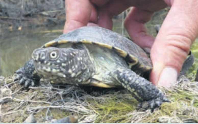
Sumpfschildkröten aus dem Zoo werden an geheimen Standorten Hessens ausgewildert.