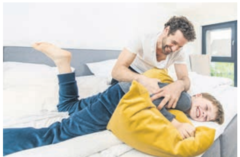
Für ein rundum gelungenes Wohlfühlambiente: Mit Produkten von MELLERUD hat Schimmel keine Chance!

Weitere Produktinfos sowie hilfreiche Tipps zur Minimierung der Schimmelgefahr gibt es unter www.mellerud.de/schimmelhaus .