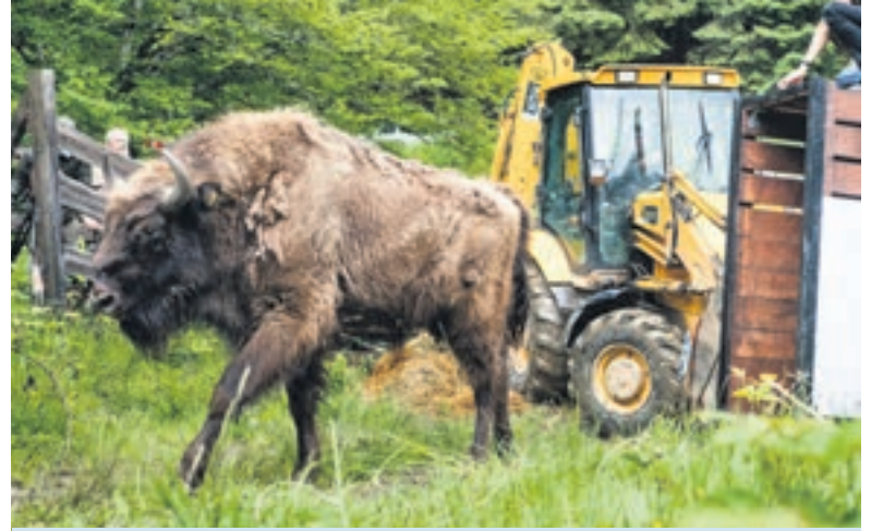
Aus der Transportbox hinaus ins wilde Leben: Europäische Wisente bei der Auswildern.