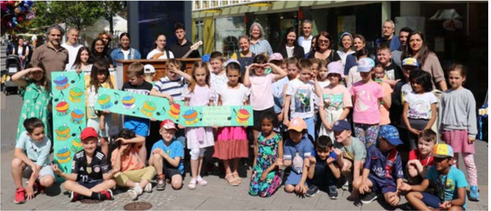
Initiatoren und Akteure mit Kindern der Beethoven- und der Mathildenschule beim Auftakt der Aktion Spiel mich! – OF Klaviere.