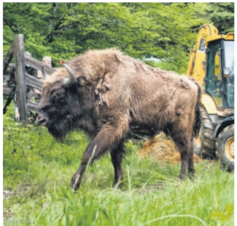
Aus der Transportbox hinaus ins wilde Leben: Europäische Wisente bei der Auswilderung.

Frankfurt aufgezogen und an einem geheimen Standort in Hessen in die Wildnis entlassen werden konnten. Unter www.zoo-frankfurt.de gibt es weitere Infos zu Artenschutzprojekten. Im Zoo Heidelberg in Baden-Württemberg wiederum hat man sich dem Erhalt des Waldkräpplers verschrieben. Der stark gefährdete Zugvogel wird hier und in weiteren Tiergärten hauptsächlich aus Artenschutzgründen gehalten und in Spanien ausgewildert. Ein herausragendes Beispiel für die Artenrettung durch Zoos ist der Europäische Wisent, für das sich unter anderem Zoo und Tierpark Berlin einsetzen. Das letzte wildlebende Exemplar des zotteligen Wildrinds wurde 1927 erschossen und verschwand damit beinahe gänzlich von der Erde. Mithilfe eines aufwändigen Zuchtprogramms in der Hauptstadt und in Zusammenarbeit mit dem WWF Deutschland werden nun heranwachsende Wisente im Shakhdag Nationalpark im Kaukasus angesiedelt. Mehr unter www.tierpark-berlin.de und www.vdz-zoos.org . Ziel ist es, dort wieder einen überlebensfähigen Bestand aufzubauen. Zoo-Besucher können mit ihren Tickets in vielen Fällen einen direkten Beitrag für bedrohte Tiere und deren Lebensräume leisten.