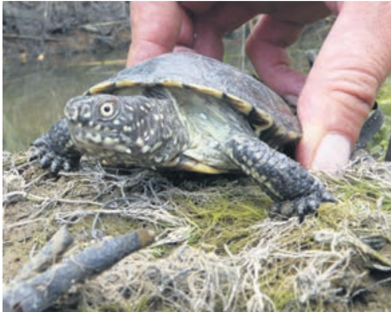
Sumpfschildkröten aus dem Zoo werden an geheimen Standorten Hessens ausgewildert.