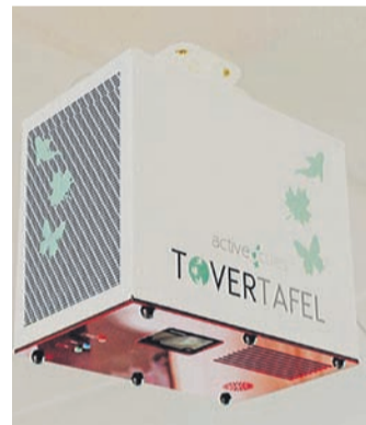
Die Tovertafel holt die Menschen aus ihrer mentalen

Isolation und lässt sie Glücksmomente, Spaß und Gemeinsamkeit erleben. Sie bietet eine Fülle von Spielen, die je nach dem Grad der Demenz individuell gewählt und eingesetzt werden können, von anregend bis beruhigend.