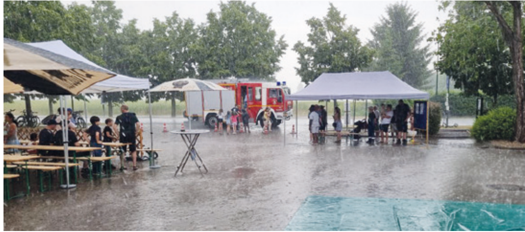
Wetterumschwung während des Feuerwehrfestes.