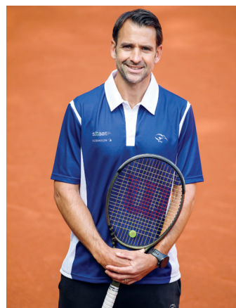
Nicolas Kiefer kommt am 17. Juni zum Jubiläumsfest des Tennisclubs Blau-Weiß Erzhausen.

um das TCE-Jubiläumsfest und zum Vorverkauf für die Party finden Sie auf unserer Webseite unter www.tennis-erzhausen.de/60-Jahre/