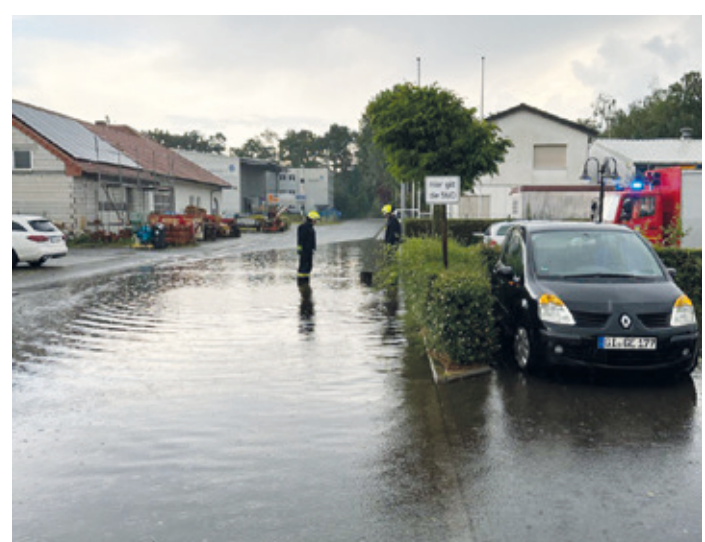
Dank an alle Erzhäuser Kräfte für Euren ununterbrochene Einsatz und Zusammenhalt während des Feuerwehrfestes und der Einsätze über mehrere Tage. Es schließen sich nun noch intensive Aufräum- und Reinigungsarbeiten an.