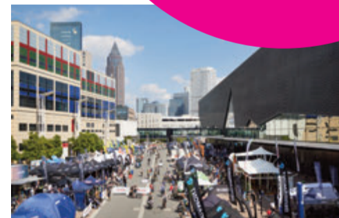
DEMO AREA + TEST TRACK