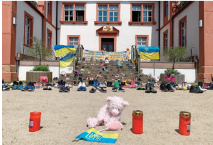
500 Paar Schuhe auf den Stufen von Schloss Fechenbach, ein Bild, das die Grausamkeit des Krieges in der Ukraine verdeutlichen soll.