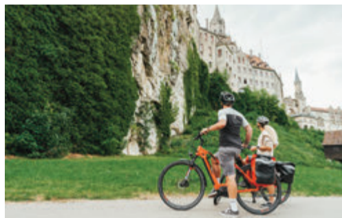
BIKE TRAVEL AREA