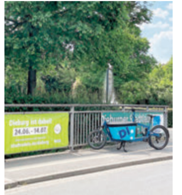
SVom 24. Juni bis 14. Juli heißt es in Dieburg, auf das Rad zu steigen und beim „Stadtradeln 2023“ Kilometer zu sammeln.

Zum Stadtradeln anmelden können sich Interessierte online unter www.stadtradeln.de/dieburg_red