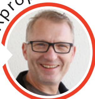
von Volker Zaborowski, Chefredakteur