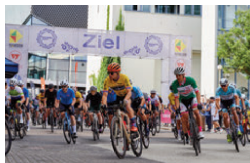
RADRENNEN BEMBEL CRIT