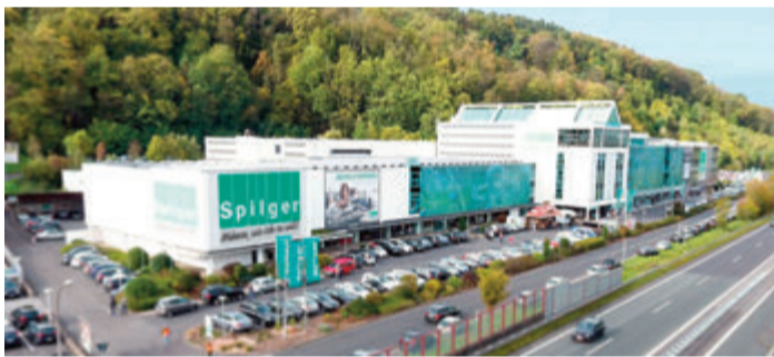
Möbelhaus Spilger in Obernburg.