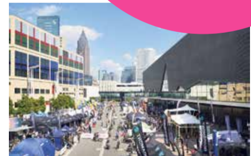
DEMO AREA + TEST TRACK