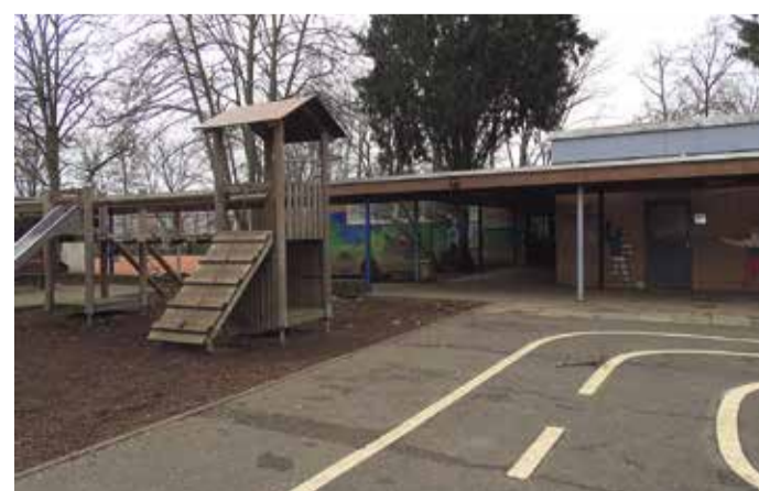
An der Albert-Schweitzer-Schule bietet der Schulhof viel Platz zum Spielen.