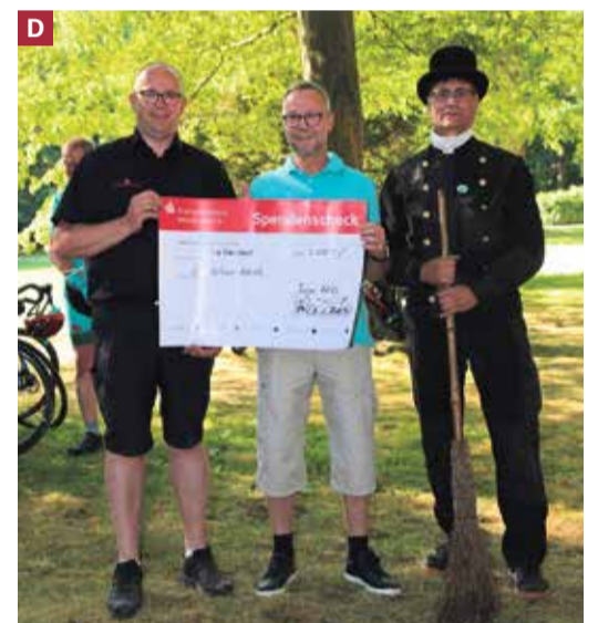
Schornsteinfeger Innung als Gastgeber – Scheckübergaben an die Vereine.