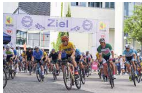
RADRENNEN BEMBEL CRIT