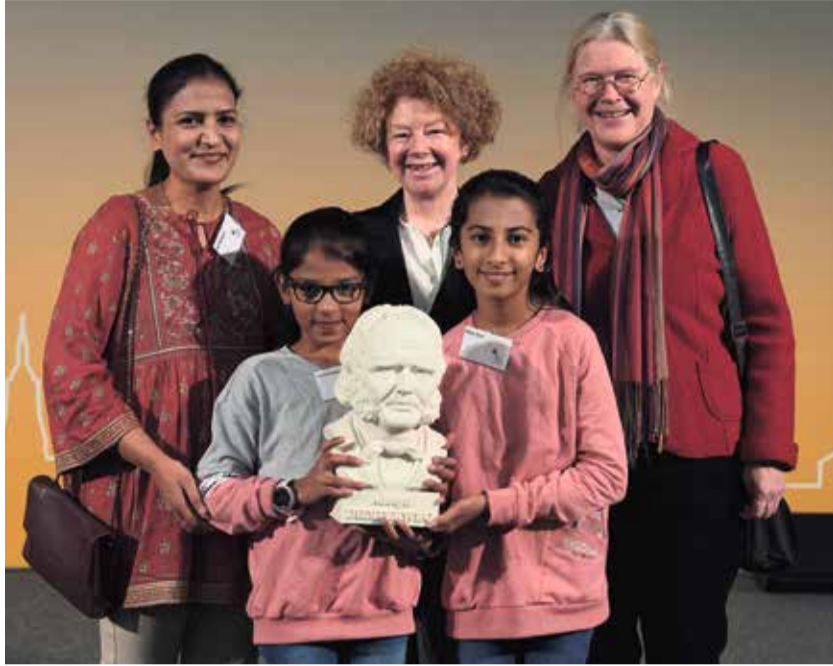
Diesterweg-Stipendium – eines von vielen Förderprogrammen.

8,6 Mio. Euro für gemeinnützige Aktivitäten - Tätigkeitsbericht 2022 der Stiftung Polytechnische Gesellschaft