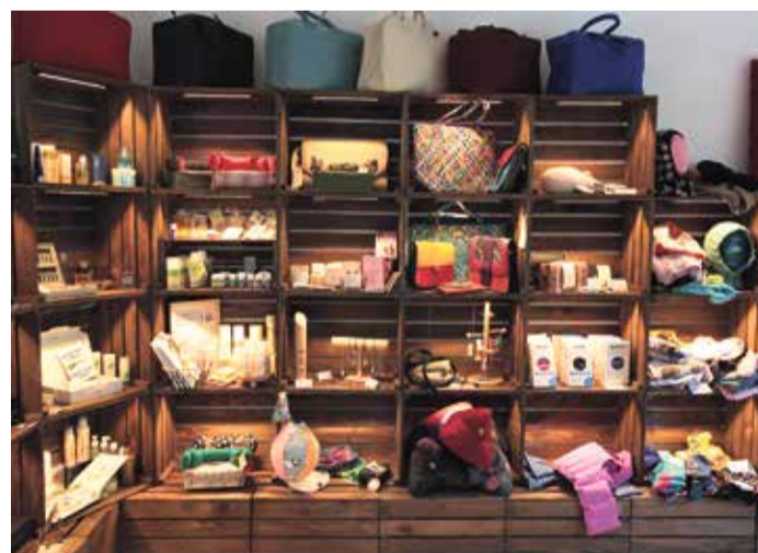
Geschenkideen für Genießer und Freunde von individuellen Präsenten.

Besondere Produkte brauchen auch einen besonderen Standort. 's Fachl ist heute an über