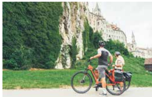
BIKE TRAVEL AREA