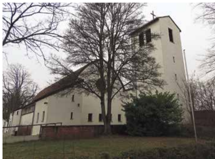
Als Notkirche wurde die Bethanienkirche bewusst schlicht gehalten.

Im frühen 20. Jahrhundert entwickelte sich der Frankfurter Berg zu einer bedeutenden Arbeiterkolonie. Um das Jahr 1937 wurden gemäß dem Reichsheimstättengesetz traditionelle kleinere Hausformen und Siedlungsstrukturen errichtet, um den Zusammenhalt in der Nachbarschaft zu stärken. Als Frankfurt sich darauf vorbereitete, Bundeshauptstadt zu werden, entstand 1948 die sogenannte "Bizonale Siedlung". Der Begriff "Bizone" bezeichnete den Teil Deutschlands, der nach dem Zweiten Weltkrieg von den US-amerikanischen und britischen Besatzungsmächten verwaltet wurde. Ziel war es, Wohnraum für neu ankommende Bundesbeamte zu schaffen. Der Architekt Herbert Boehm orientierte sich dabei an den Ideen von Ernst May. Die Reihenhäuser wurden in Vierteln angeordnet, um den natürlichen Höhenverlauf des Frankfurter Bergs zu integrieren und eine harmonische Umgebung zu schaffen.