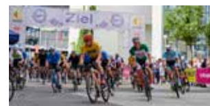
RADRENNEN BEMBEL CRIT