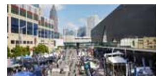
DEMO AREA + TEST TRACK