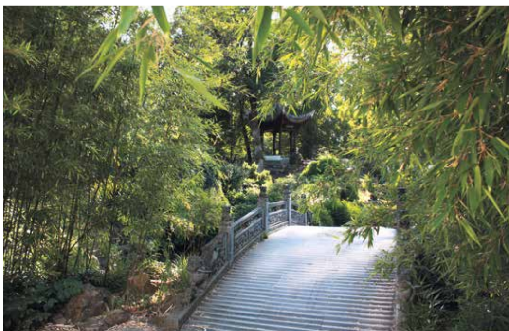
Kühler Ort: Der chinesische Garten.

Weitere Informationen finden sich online unter frankfurt.de/hitze .