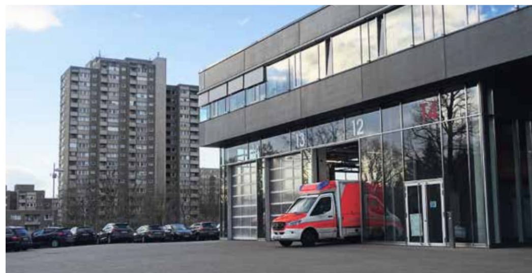
Die Feuer- und Rettungswache 1 übernimmt eine Vielzahl von Sonderaufgaben für die Stadt Frankfurt.

Das Eckenheimer Depot, auch bekannt als "Wagenhalle Eckenheim", hat seit 1911 eine bedeutende Rolle als Straßenbahndepot in Frankfurt. Mehr als 30 Gleise wurden überdacht, um die Straßenbahnen vor den Witterungseinflüssen zu schützen. Es ist das einzige Depot in Frankfurt, das den Angriffen des Zweiten Weltkriegs unbeschadet standhielt. Während des Krieges wurden einige besondere Wagen unter Planen versteckt, die erst 1950 wiederentdeckt und ins Verkehrsmuseum nach Schwanheim gebracht wurden. Heute dient das Eckenheimer Depot als Sitz des Vereins Historische Straßenbahn der Stadt Frankfurt und als Wagenhalle.