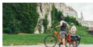
BIKE TRAVEL AREA