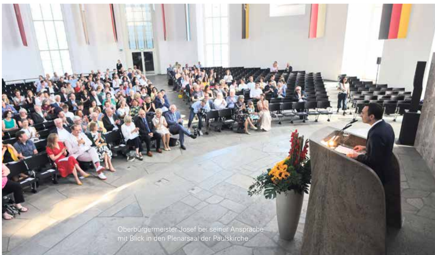
Oberbürgermeister Josef bei seiner Ansprache mit Blick in den Plenarsaal der Paulskirche.

Mit Lichter Filmkunst und seinem Lichter Filmfest Frankfurt International reiht sich ein weiterer kulturelle Maßstäbe setzender Binding-Kulturpreisträger aus der Heimatregion von Binding in die seit dem Jahr 1996 währende Tradition ein.