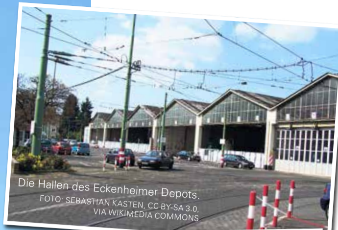
Die Hallen des Eckenheimer Depots.

Der Kirchturm wird mit seiner Höhe von 56 Metern von fast jedem Platz im Stadtteil gesehen.