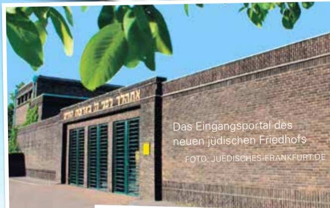
Das Eingangsportal des neuen jüdischen Friedhofs