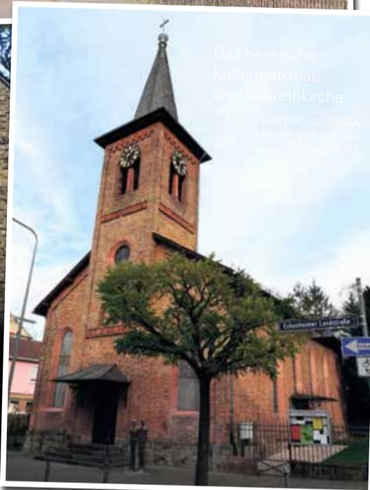
Das hessische Kulturdenkmal, die Nazarethkirche.

ECKENHEIM (BG) | Eckenheim, ein Stadtteil von Frankfurt, kann auf eine lange und bewegte Geschichte zurückblicken. Bereits im Jahr 795 wurde das Dorf erstmals erwähnt und befand sich damals in einem königlichen Jagdgebiet. Im Mittelalter wurde Eckenheim, damals als Ekinheim bekannt, zum Streibobjekt zwischen den Städten Hanau und Frankfurt. Obwohl es zu Frankfurt gehörte, hatte Hanau das Sagen. Mit der Reformationszeit begann eine neue Ära, und Eckenheim wurde wieder Teil von Frankfurt, nur um in der napoleonischen Zeit erneut dem Kurfürstentum Hanau zugeordnet zu werden. Erst 1910 endete das Hin und Her, und Eckenheim wurde endgültig ein Teil von Frankfurt. Mit der Eingemeindung brachen moderne Zeiten an. Das Dorf erhielt Gas- und später elektrische Straßenbeleuchtung. Eckenheim wurde an das Kanalnetz angeschlossen und die Einwohner konnten mit der Straßenbahn bequem nach Frankfurt fahren. Heute ist Eckenheim bei vielen Pendlern, die in der Innenstadt arbeiten, eine beliebte Wohnadresse. Kein Wunder, denn der Stadtteil bietet eine ruhige Atmosphäre, erschwingliche Mieten und ist besonders bei Familien mit Kindern sehr beliebt. Eine Busfahrt nach Frankfurt dauert nur 15 Minuten und Autofahrer können die A661 nutzen. Obwohl die Infrastruktur nicht mehr so gut ist wie vor einigen Jahren, hat Eckenheim immer noch seinen Charme als liebenswerter Wohnort behalten.