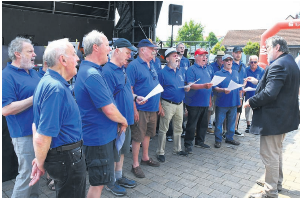
Gastgeber GV Liederkranz-Frohsinn Eppertshausen ließ sich zwei Ständchen zur Mittagszeit nicht nehmen.

„Wir wollen mit dem Schlachtfest jetzt noch stärker auch das jüngere Publikum ansprechen“, sagte Dony und führte aus, wen er meinte. Einerseits