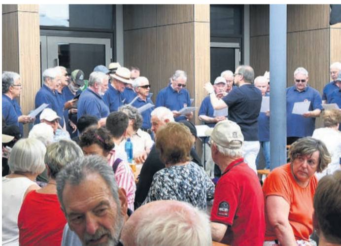
Der GV Germania Eppertshausen war einziger Gastchor der Mini-Matinee.

Hiermit lädt der Vorstand der FVCA recht herzlich zur Jahreshauptversammlung am Freitag, 23. Juni, um 19 Uhr in die Vereinsgaststätte des FV Eppertshausen, Nieder-Röder Straße 99 in Eppertshausen ein.