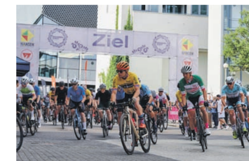
RADRENNEN BEMBEL CRIT