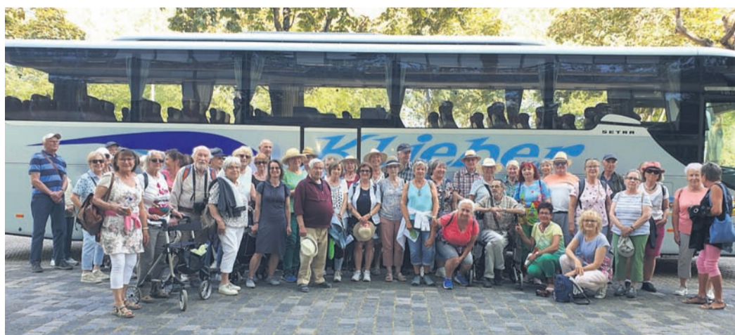
50 Personen nahmen am Ausflug der Seniorenhilfe teil.

Nach langer Pause freute sich die Seniorenhilfe Eppertshausen wieder eine Tagesfahrt anbieten zu können. Auf dem BUGA-Gelände angekommen spazierte die Mehrheit der Reisegruppe zunächst zum Einstiegspunkt der Seilbahn, welche speziell für die Ausstellung gebaut wurde, um zum Spinelli-Park zu gelangen. Dieses Gelände hat im Vergleich zum Luisenpark einen deutlich jüngeren Baumbestand. Schon der Blick aus einer der 64 Gondeln über das Ausstellungsgelände zu Beginn war herrlich und hat zudem einen ersten Eindruck über die Ausmaße der BUGA23 vermittelt. Die Teilnehmer spazierten zu Zweit oder in Grüppchen je nach ihren eigenen Bedürfnissen durch die verschiedenen Ausstellungen in den Hallen, wandelten entlang der Wege