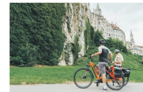
BIKE TRAVEL AREA