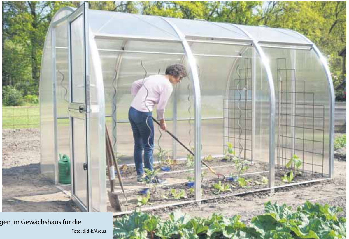
Weit zu öffnende Seitenelemente sorgen im Gewächshaus für die notwendige Frischluftzufuhr.

(DJD-K). Wem die Gartensaison nicht lang genug ist, der kann sich mit einem Gewächshaus einen zeitlichen Zuschlag verschaffen und die Aussichten auf eine gute Obst- und Gemüseernte steigern. Besonders rückschonend und bequem ist das Arbeiten auch noch. Neben diesen Vorteilen bietet etwa das Gewächshaus Arcus weitere praktische Eigenschaften. Durch den Fundamentrahmen lässt es sich beliebig versetzen, um eine Bodenermüdung zu vermeiden. Mit fünf Standardlängen von 2,10 Metern bis zu 6,10 Metern und einer Breite von 3,15 Metern passt es gut in kleinere Gärten. Die stufenlos verschiebbaren Seitenscheiben können entweder ein- oder beidseitig bis unter das Dach hochgeschoben werden, sodass das Gewächshaus fast vollständig geöffnet wird. Unter www.hoklartherm.de etwa gibt es mehr Informationen dazu.