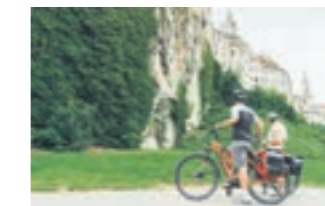
BIKE TRAVEL AREA