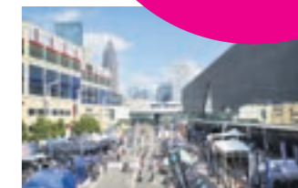
DEMO AREA + TEST TRACK