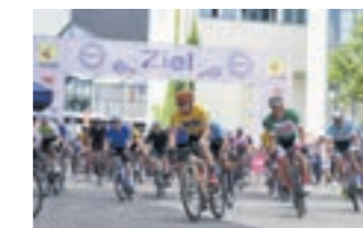
RADRENNEN BEMBEL CRIT