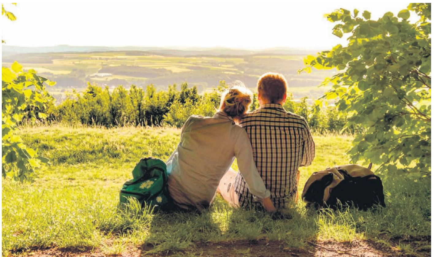
Weit geht der Blick der Wanderer in den „Gottesgarten am Obermain“, eine der schönsten Regionen Deutschlands.

Der Fränkische Marienweg verbindet auf fast 2.000 Kilometern insgesamt 87 fränkische Wallfahrtsorte. Seit 2020 führt er auch durch den Gottesgarten am Obermain. Ein schöner Abschnitt dieses Fernwander-