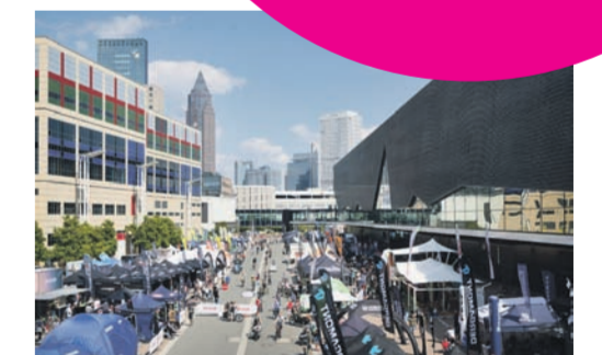
DEMO AREA + TEST TRACK