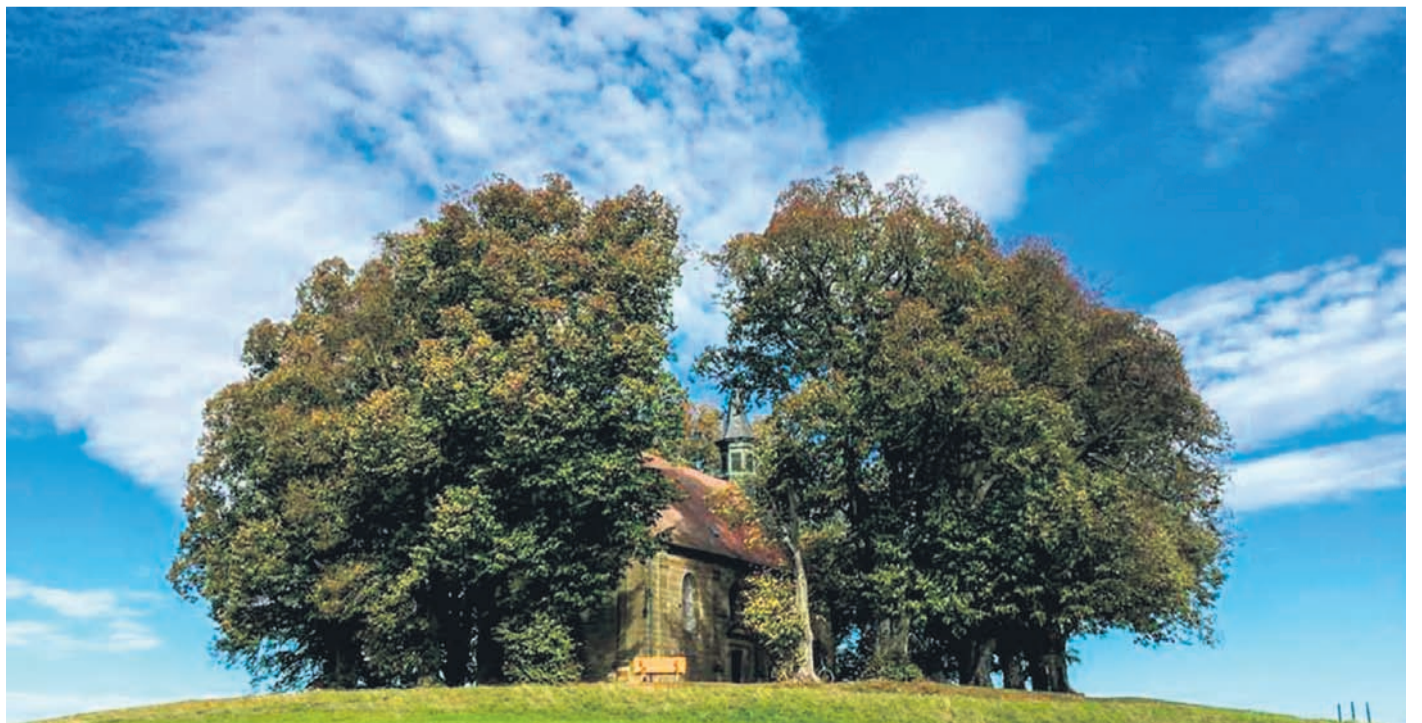
Auf dem Ansberg - im Volksmund Veitsberg genannt - befindet sich die St.-Veits-Kapelle, die von einem 200 Jahre alten Lindenkranz umgeben ist, er gilt als der älteste Europas

wegs lässt sich von Ebensfeld Veitsberg entdecken. Tipp: Auf St.-Veits-Kapelle, die von einem umgeben ist, er gilt als der älteste Europas.