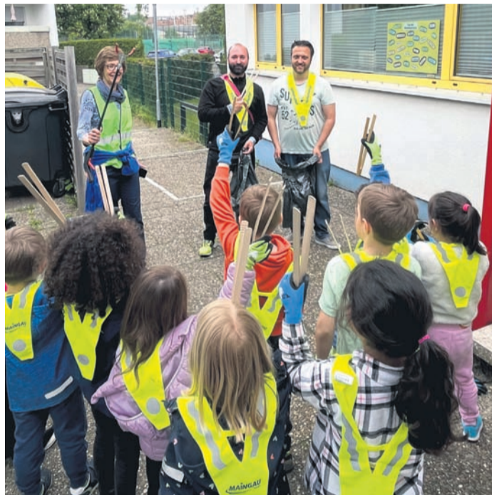
Geschützt durch Handschuhe und ausgerüstet mit Müllzangen und Müllbeuteln, haben die Kinder der Kita Rodastraße zusätzlich von den Verantwortlichen der Initiative #einfachBÜCKEN.

Der „Sauberhafte Kindertag“ findet jährlich im Rahmen der Umweltkampagne „Sauberhaftes Hessen“ des Hessischen Ministeriums für Umwelt, Klimaschutz, Landwirtschaft und Verbraucherschutz statt. So nahmen in Obertshausen sieben städtische Kindertagesstätten daran teil. Erzieher*innen und Kinder der Kita Rodastraße und der Kita Mühlheimer Straße sind mit gutem Beispiel vorangegangen und haben Straßen, Plätze und Grünflächen von Müll befreit. „Ich bin begeistert, dass erstmals alle sieben städtischen Kindertagesstätten mitgemacht haben. Zudem möchte ich mich auch nochmal bei