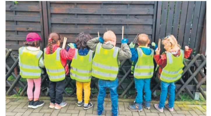
Auch die Kinder der Kita Mühlheimer Straße möchten in einer sauberen Umgebung aufwachsen und spielen.

Wer ebenfalls etwas für eine saubere Umwelt tun und die Stadt Obertshausen von Müll befreien möchte, kann am Samstag, 16. September, bei dem weltweiten Aktionstag „World Clean Up Day“ teilnehmen. Interessierte Privatpersonen oder auch Vereine können sich bereits jetzt schon per E-Mail: bauhof@obertshausen.de oder unter Telefon: 06104 7037400 sowie Telefon: 06104 7037401 anmelden.