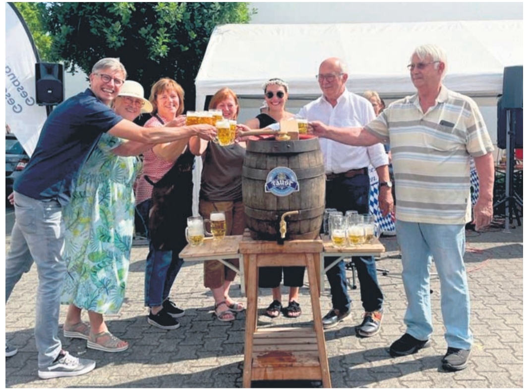
Germania trugen einige Stücke vor.