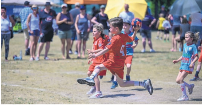
Am Sonntagmorgen zeigten die jüngeren Jahrgänge von F- bis D-Jugend, dass sie Handball spielen können.

Nieder-Roden (RZ) Auch mit dem zweiten Feldturnier nach der Corona-Pause waren die HSG-Verantwortlichen wieder vollauf zufrieden. Zwar gab es aufgrund der immer noch laufenden Qualifikationsturniere weniger Meldungen, doch die Teams die am Samstag und Sonntag auf dem Sportplatz am Breitwiesenring anwesend waren, boten den zahlreichen Besuchern bei bestem Wetter tollen und fairen Handballsport. Der Samstagabend war für die älteren Jugendklassen reserviert. Bei der männlichen A- und B-Jugend wurden die Baggerseepiraten ihrer Favoritenrolle gerecht und sicherten sich den Turniersieg. Einen echten Krimi gab es im Finale der C-Jugend, in dem die Rodgauer dem Oberliga-Rivalen aus Pfungstadt knapp unterlagen. Abends stieg dann die große Saisonabschluss-Par-