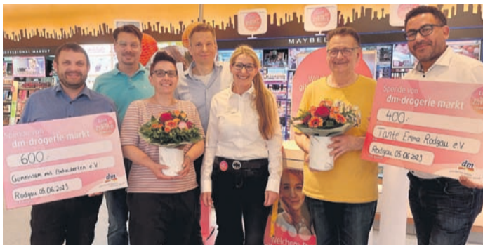
Gemeinsam für Behinderte e.V., Tante Emma e.V. und die Besi & Friends-Stiftung bei der Spendenübergabe in Rodgau.

Rodgau (RZ) Unter dem Motto „Lust auf Zukunft“ feiert dm-drogerie markt 2023 seinen 50. Geburtstag und hat zu diesem Anlass die dm-Zukunftsinitiative ins Leben gerufen. Im Rahmen dieser Initiative fördert dm deutschlandweit rund 3.000 Organisationen, Projekte oder Vereine, die sich für Zukunftsthemen einsetzen, mit mehr als 2,1 Millionen Euro.