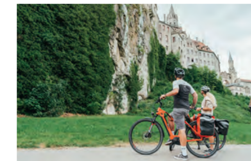
BIKE TRAVEL AREA