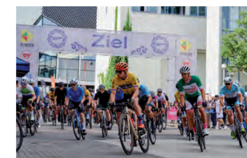
RADRENNEN BEMBEL CRIT