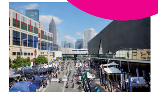
DEMO AREA + TEST TRACK