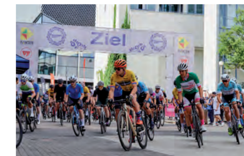
RADRENNEN BEMBEL CRIT