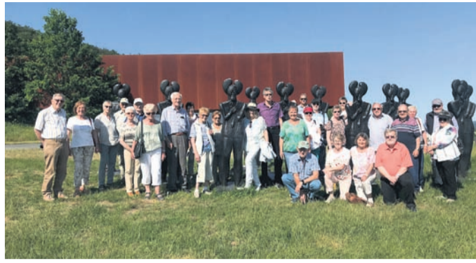
Die Ausflügler der DJK auf dem Glauberg.