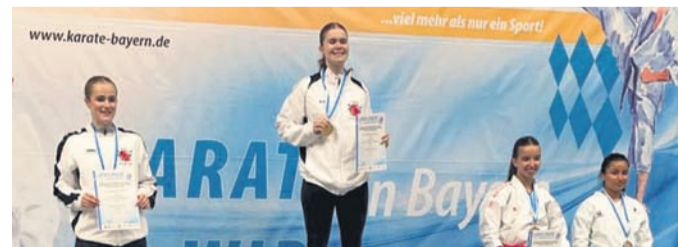
GKV Lotus Eppertshausen

Vorbereitung: Das Team 1A, welches in der KOL DI-Odenwald die letzte Saison 22/23 mit einem hervorragenden 5. Rang beendete, nahm am Sonntag das Training wieder auf. Nach dem Training fand sich auch das Team 1B im Biergarten des TSV Altheim ein, um gemeinsam mit dem Trainerstab und dem GFV über Zielsetzungen sowie Veränderungen auszutauschen. Weitere Details folgen in den kommenden Wochen, der Geschäftsführende Vorstand tagt am 3. Juli um 19.30 Uhr. Ein erstes Vorbereitungsspiel findet auch schon am 2. Juli, um 16 Uhr statt: TSV Altheim - Hellas Darmstadt. Stadtradeln: Der TSV fährt auch in diesem Jahr beim Stadtradeln vom 24. Juni bis 14. Juli mit. Einfach Registrieren, dem Team „TSV Altheim“ beitreten und geradelte Kilometer eintragen: https://www.stadtradeln.de/index.php?id=171&L=0&team_preselect=67606