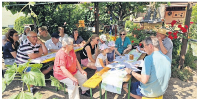
Bienen zum Anfassen.

Jugendfreizeit nach Senigallia - noch Plätze frei: „Sommer, Sonne, Senigallia“ ist im Zeitraum vom 21. bis 30. August angesagt. Unter diesem Motto bietet die Kolpingsfamilie in Kooperation mit der bürgerlichen Gemeinde Eppertshausen eine Sommerfreizeit für Jugendliche ab 15 Jahren an. Die Gruppe ist im Feriendorf Benivere