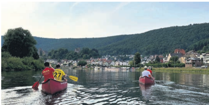
Kanoutour auf dem Neckar.