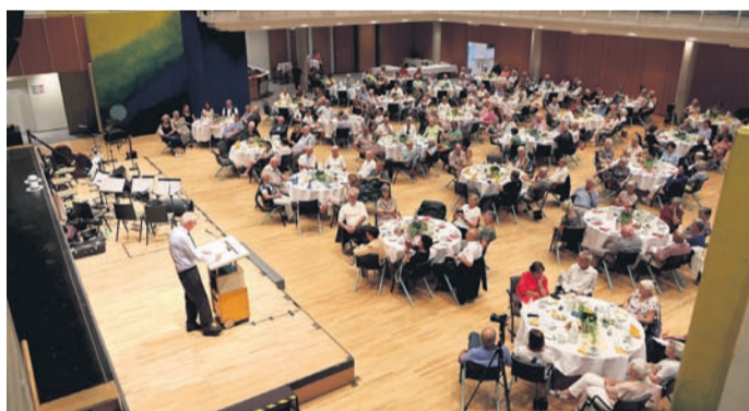
Viele Mitglieder und Wegbegleiter waren zur Jubiläumsfeier in die Kulturhalle gekommen.

Rödermark (PS) - Viele Mitglieder und Wegbegleiter hatte der Vorstand der Seniorenhilfe Rödermark zur Jubiläumsfeier zum 25-jährigen Bestehen in die Kulturhalle eingeladen.