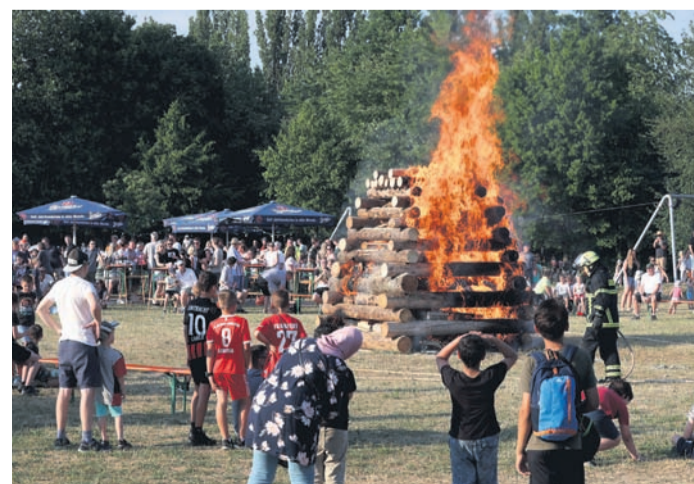
fer reichlich zu tun, um die Besucher mit Gegrilltem, Crêpes oder Getränken zu versorgen.

Urberach (PS) Bereits vor dem Entzünden des Feuers herrschte am Samstag hinter dem Badehaus Hochbetrieb. Das Sonnwendfeuer der Urberacher Jugendfeuerwehr erwies sich als echter Besuchermagnet. In diesem Jahr wurde das Feuer früher entzündet als in der Vergangenheit. Am Nachmittag hatte es für die jüngeren Besucher unter anderem Kistenstapeln gegeben, am Spritzenhaus konnte sich der Nachwuchs im Löschen üben. An den Essen- und Getränkeständen hatten die vielen Hel-