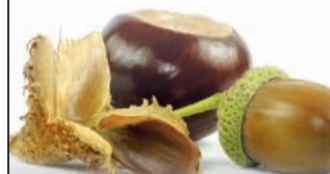
Beratung, Betreuung, Begleitung

Eiche rustikal oder Buche hell es gibt viele Nuancen. Wir beraten Sie zu allen Produkten und Möglichkeiten.