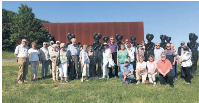
Die Ausflügler der DJK auf dem Glauberg.