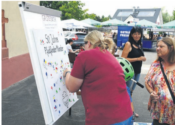
Auf dem 50-Jahr-Fest der Münsterer Pfadfinder konnte jeder seinen Gruß in Form eines unverfälschten Fingerabdrucks hinterlassen.

terstützen. Alle bis 14. Juli gefahrenen Kilometer können auf der Seite www.stadtradeln.de oder in der App eingetragen werden.