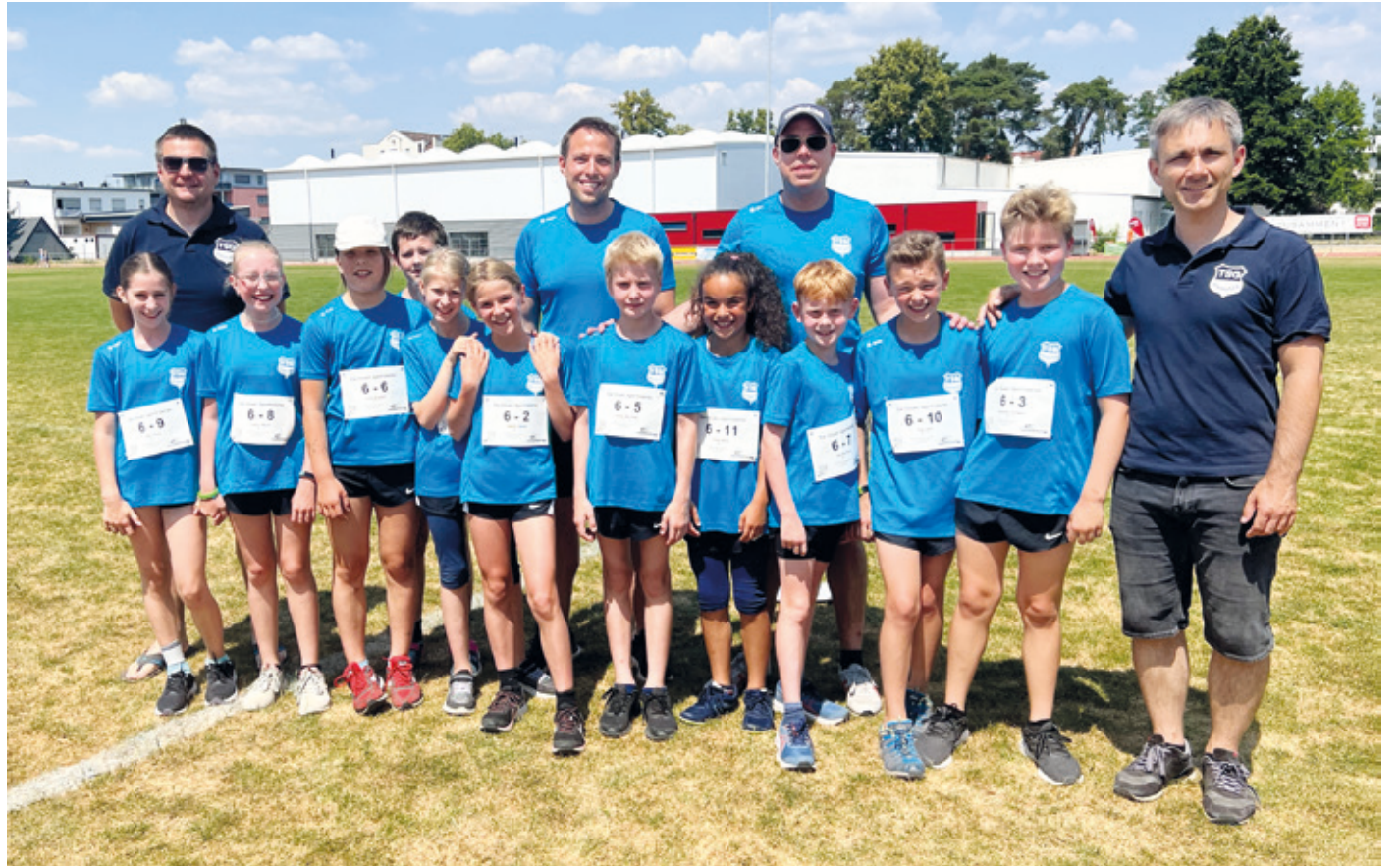
Auf dem Bild das Team „Die blauen Sportraketen“ der TSG Wixhausen.

(mg) Mit sommerlichen Temperaturen nahmen am Samstag, den 17.06.2023, die Leichtathletik-Kinder der TSG Wixhausen am zweiten Wettkampf der Kinderleichtathletik-Liga in Griesheim der Altersklasse U12 teil. Insgesamt