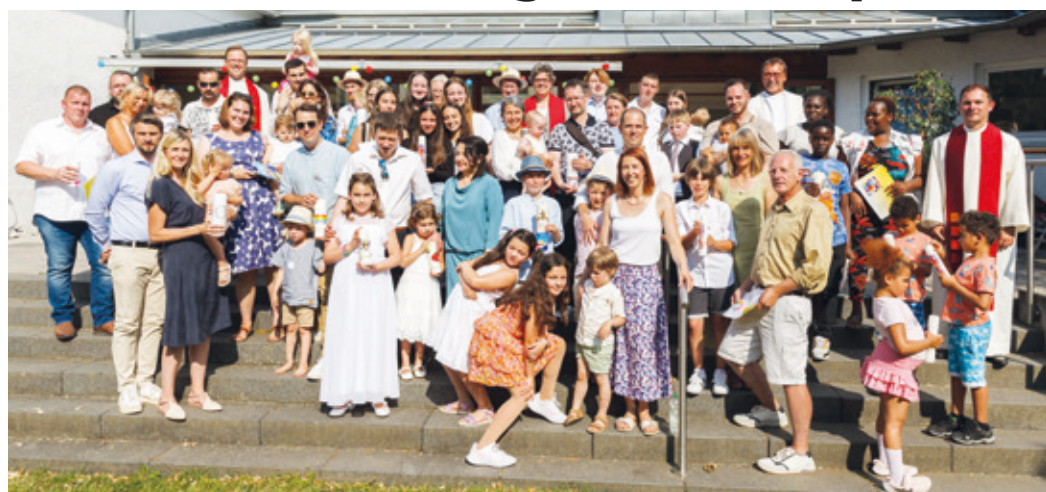
Das Bild zeigt die 19 Täuflinge der Auferstehungsgemeinde gemeinsam mit ihren Eltern auf der Terrasse des Gemeindehauses.

Nach dem Gottesdienst begann ein fröhliches Zusammensein bei Gegrilltem und einer reichhaltigen Salattheke. Den Dienst am Würstchen-