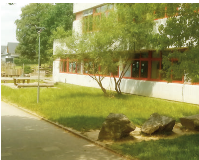
Ein Blick auf die Grundschule. Die Nachmittagsbetreuung ist für das kommende Schuljahr in den Händen eines freien Trägers.

Das Landratsamt hingegen sieht sich jedoch primär der Schule und dem Bildungsauftrag verpflichtet. Weitere Räume wären in der benachbarten Georg-Ackermann-Schule, hätten die Möglichkeit von Mensanutzung und Arbeitsgruppen eröffnet, aber auch ein Mehr an Personalaufwand. Das hätte weitere Kosten zur Folge gehabt, auch für die Eltern, die erst letztes Jahr eine Gebührenerhöhung hinnehmen mussten.