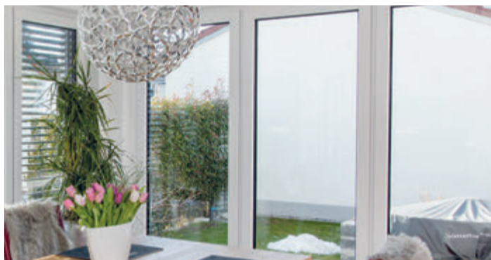
Glas ist der ein Baustoff, der Wärmedämmung und solare Energiegewinne gleichzeitig ermöglicht.

(spp-o) Moderne Isolierverglasungen erfüllen heute multifunktionale Ansprüche: Sie bieten exzellente Wärmedämmung gegen winterliche Heizwärmeverluste. Gleichzeitig sorgen moderne Verglasungen mit hoher Transparenz für viel Tageslicht und solare Energiegewinne im Winter. Je nach Orientierung und Größe der Glasfläche gibt es Varianten für sommerlichen Wärmeschutz, Schallschutz in der Stadt, Sicherheit und vieles mehr. „Zuverlässige Funktion und Schutz vor materialbedingten Schäden bieten jedoch nur Verglasungen mit geprüfter Qualität“, weiß Jochen Grönegras, Geschäftsführer der Gütegemeinschaft Flachglas (GGF). Auf Nummer sicher geht, wer auf das RAL-Gütezeichen achtet. Jedes Gebäude ist so einzigartig wie seine geografische Lage mit den dazugehörigen klimatischen Bedingungen und energetischen wie ästhetischen Anforderungen. Hochwertiges Isolierglas lässt sich über seinen Aufbau und moderne Funktionsbeschichtungen an jeden Anspruch anpassen. Wichtig: Das RAL-Gütesiegel bürgt auf Isoliergläsern für geprüfte Qualität – das minimiert die Gefahr des Funktionsverlusts, der durch Materialfehler im Laufe der Zeit auftreten kann. Während minderwertige Isoliergläser im Laufe der Jahre undicht werden können und dann – katastrophal für Klima und Geldbeutel – ihre wärmedämmenden Eigenschaften einbüßen, behalten hochwertige Produkte ihre technischen Werte in der Regel für Jahrzehnte.