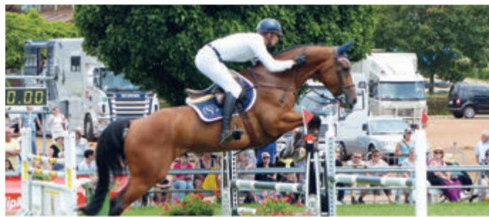
Beerfelder Pferdemarkt startet durch Seiten 8-9