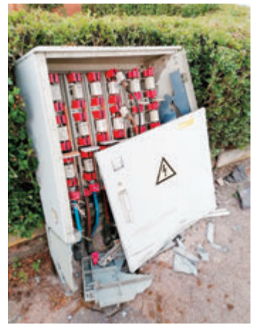
Der Verteilerkasten wurde stark beschädigt, mehrere Anwohner hatten keinen Strom.

Verdächtigen aus den Augen, sichtete das Auto gegen 5 Uhr in der Theodor-Heuss-Straße in Etzen-Gesäß. Vom Fahrzeugführer fehlte jede Spur. Am Auto konnten mehrere Beschädigungen festgestellt werden, darunter ein plattgefahrener Reifen sowie ein beschädigter Kotflügel. In der Nähe fand die Polizei einen demolierten Stromverteilerkasten, der vermutlich durch den 24-Jährigen touchiert wurde. Mehrere Anwohner hatten für einige Zeit keinen Strom mehr. Der Schaden am Verteilerkasten und dem Auto wird auf etwa 15.000 Euro geschätzt. Mit weiterer Unterstützung, unter anderem einem Diensthund, konnte der Fahrer aus Oberzent festgenommen werden. Er hatte sich hinter einem Haus nahe der Theo-