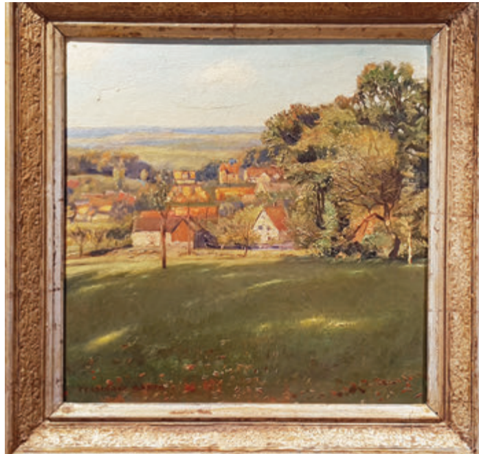
Lützelbach (Modautal), wie es Ferdinand Barth gesehen hat.