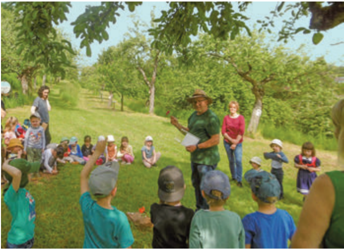
Eine der vielen Aktivitäten der Kita: Wissenswertes über Bienen und Blüten lernen.

Groß-Umstadt. In der Raibacher Halbedelsteinsuchen, Wasserspiele, Glücksrad, eine Bildversteinerung und viele weitere Bestehen gefeiert. Aktivitäten finden an dem Tag statt. red