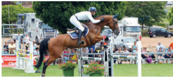
Beerfelder Pferdemarkt startet durch Seiten 8-9