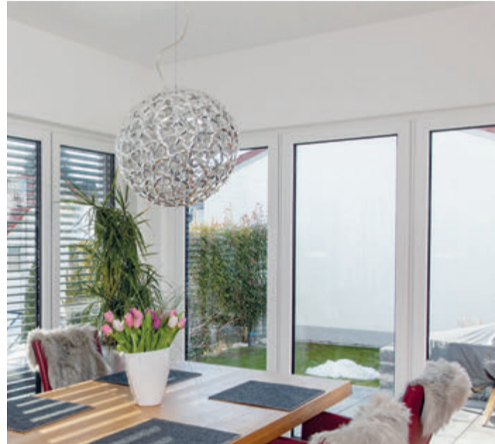
Glas ist der ein Baustoff, der Wärmedämmung und solare Energiegewinne gleichzeitig ermöglicht.

(spp-o) Moderne Isolierverglasungen erfüllen heute multifunktionale Ansprüche: Sie bieten exzellente Wärmedämmung gegen winterliche Heizwärmeverluste. Gleichzeitig sorgen moderne Verglasungen mit hoher Transparenz für viel Tageslicht und solare Energiegewinne im Winter. Je nach Orientierung und Größe der Glasfläche gibt es Varianten für sommerlichen Wärmeschutz, Schallschutz in der Stadt, Sicherheit und vieles mehr. „Zuverlässige Funktion und Schutz vor materialbedingten Schäden bieten jedoch nur Verglasungen mit geprüfter Qualität“, weiß Jochen Grönegras, Geschäftsführer der Gütegemeinschaft Flachglas (GGF). Auf Nummer sicher geht, wer auf das RAL-Gütezeichen achtet. Jedes Gebäude ist so einzigartig wie seine geografische Lage mit den dazugehörigen klimatischen Bedingungen und energetischen Anforderungen. Hochwertiges Isolierglas lässt sich über seinen Aufbau und moderne Funktionsbeschichtungen an jeden Anspruch anpassen. Wichtig: Das RAL-Gütesiegel bürgt auf Isoliergläsern für geprüfte Qualität – das minimiert die Gefahr des Funktionsverlusts, der durch Materialfehler im Laufe der Zeit auftreten kann. Während minderwertige Isoliergläser im Laufe der Jahre undicht werden können und dann – katastrophal für Klima und Geldbeutel – ihre wärmedämmenden Eigenschaften einbüßen, behalten hochwertige Produkte ihre technischen Werte in der Regel für Jahrzehnte.