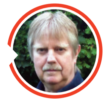
von Dr. Detlef Eichberg