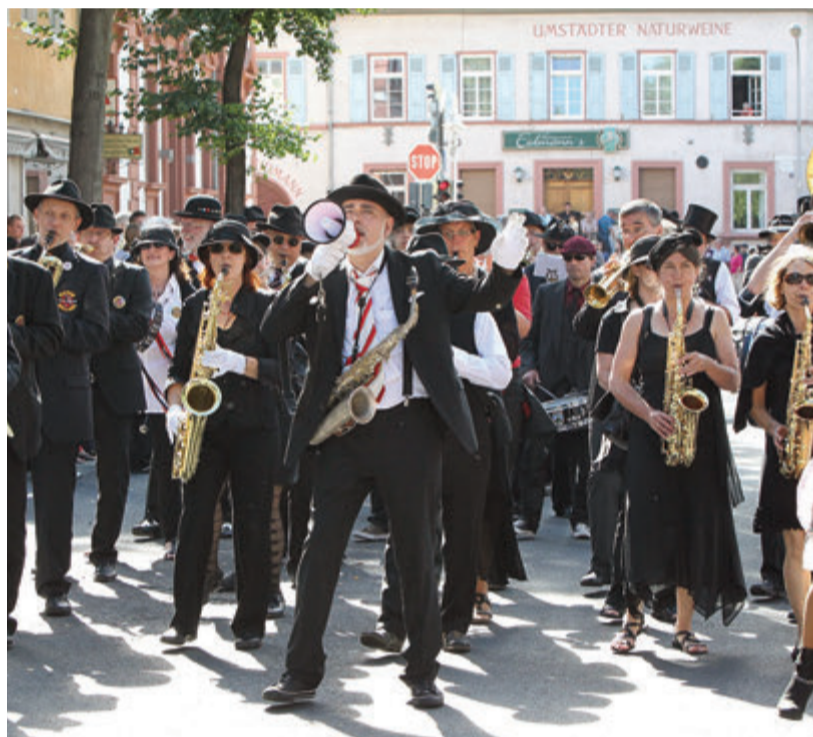
Seit Jahren immer wieder ein Highlight: Die March Mellows Street Band.

Ob stylish und elegant, klassisch und zeitlos, trendig, sportlich bis hin zu sogenannten Actionwear: Jeder Mensch mit Hut ist eingeladen, bei der Parade Hut und Mut zu beweisen. Ein Gläschen Begrüßungssekt gibt es in der Säulenhalle im historischen Rathaus, anmelden muss man sich nicht. Das einzig Wichtige ist hier die Kopfbedeckung.