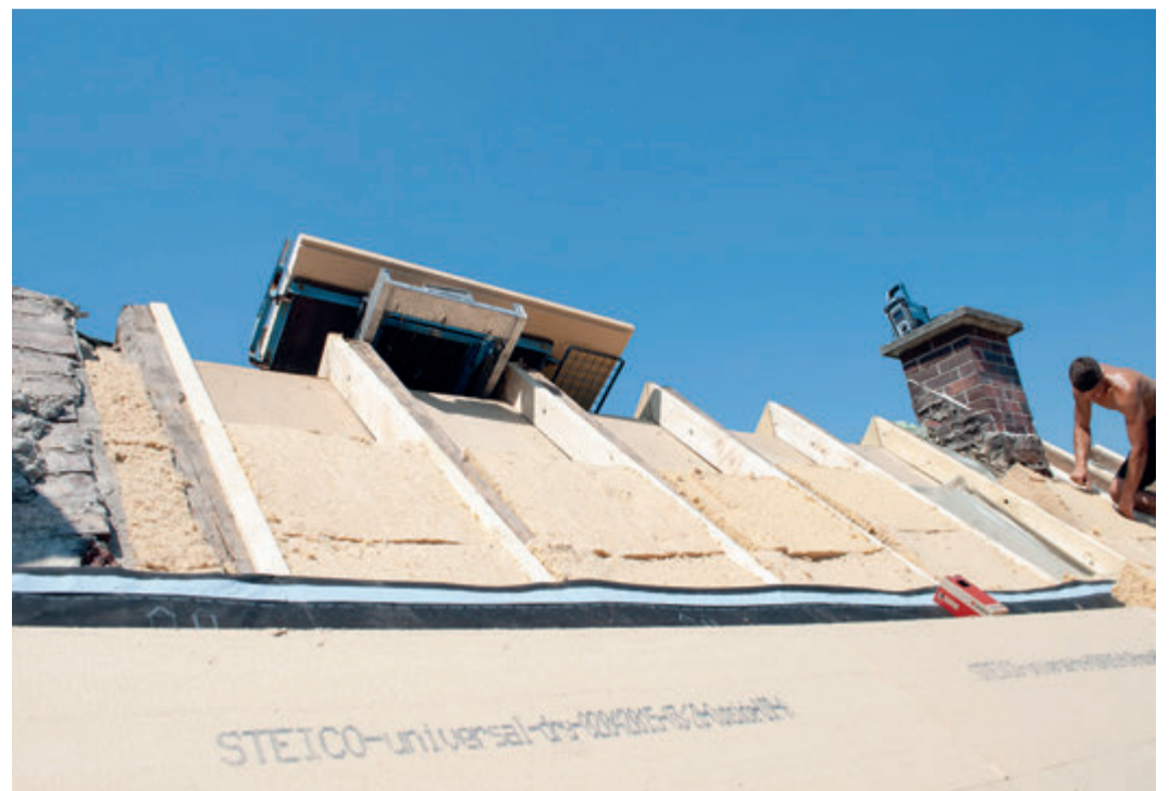
Im Sommer wirkt Hitze über Stunden auf die Dachfläche ein, schlechte Dämmung kann sie nur kurz oder gar nicht aufhalten. Wer sein Dach mit Holzfaser dämmen lässt, schützt sich gut gegen Hitze.

Nachhaltige Holzfaser-Dämmstoffe wirken das ganze Jahr hindurch als optimaler Wärmeschutz. Als effektiver Hitzepuffer ermöglichen sie es, auch an heißen Tagen gut zu schlafen und konzentriert zu arbeiten. Durch das hohe Volumengewicht, also viel Masse, die den Wärmedurchgang verzögert, kommt die Hitze gar nicht erst ins Hausinnere. Sie wird über Stunden in der Dämmschicht gespeichert. In den kühleren Nachtstunden kann die gepufferte Wärme nach außen abstrahlen. Wer sein Dach mit Holzfaser dämmen lässt, entscheidet sich für langlebiges und energieeffizientes Baumaterial aus nachwachsenden Rohstoffen. Mit doppeltem Effekt für den Klimaschutz: Dämmung ist die beste Methode, um Heizenergie, damit Heizkosten, und CO 2 -Emissionen einzusparen. Bereits die Verlegung der Holzfaser-Dämmung im Dach tut etwas für die Umwelt, denn das zur Holzfaser verarbeitete Holz bindet während seines Wachstums eine Menge klimaschädliches Kohlen-