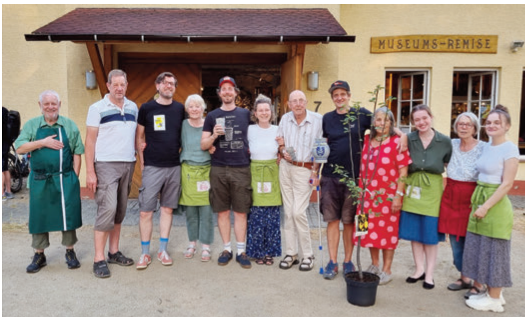
Gewinner, Platzierte und Helfer des Kulturhistorischen Vereins des 6. Roßdörfer Ebbelwoi Kontests.