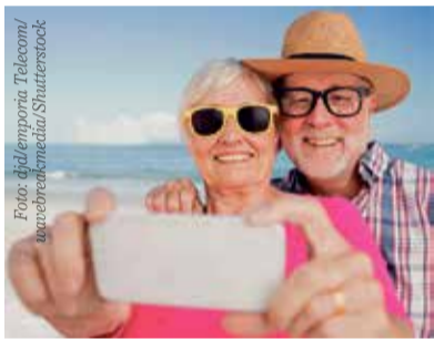
Schöne Urlaubsfotos können auch mit dem Smartphone entstehen.

Vermeiden Sie direktes Gegenlicht. Für stimmungsvolle Aufnahmen nutzen Sie das natürliche Licht in den frühen Morgen- oder Abendstunden. Reinigen Sie die Linse regelmäßig mit einem weichen Tuch. Verwenden Sie hauptsächlich das Querformat und platzieren Sie das Motiv im linken oder rechten Drittel des Bildes. Nutzen Sie den Portrait-Modus, dieser ermöglicht Porträtaufnahmen mit unscharfem Hin-