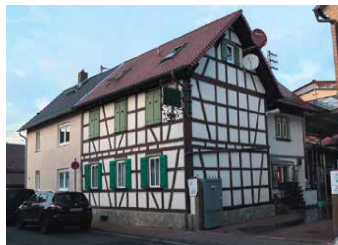
Die Landmetzgerei Quirin befindet sich in einem wunderschönen Fachwerkhäuser.

Inmitten einer grünen Oase neben dem Friedhof erhebt sich ein eindrucksvolles Denkmal, das an beide Weltkriege erinnert. Eine halbrunde Betonmauer mit einem