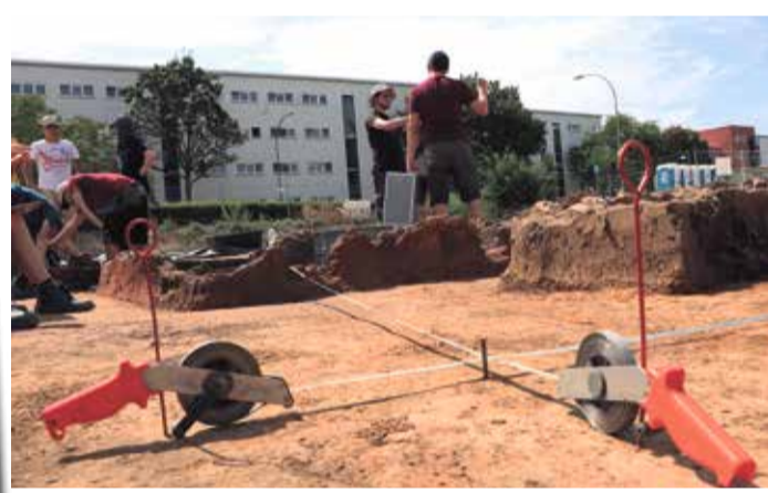
Studierende der Goethe-Uni bei der Ausgrabung. Im vorderen Bildbereich zwei Maßbänder, die beim maßstäblichen Zeichnen unterstützen.

die Archäologie und Geschichte der Römischen Provinzen bei Prof. Markus Scholz. Die Studierenden haben in Hedderheim ihre mehrwöchige Lehrgrabung absolviert. Das Untersuchungsgebiet: Drei