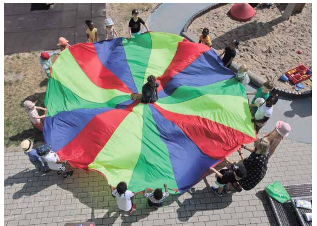
Teilnehmende Kinder am Programm „Frankfurt zaubert“.

„Frankfurt zaubert“ wurde 2021 mit dem Ziel initiiert, kurzfristig ein Maßnahmenpaket nach den coronabedingten Einschränkungen zu schnüren, um die Frankfurter Kinder und Jugendlichen zu stärken und die pädagogischen Fach- und Führungskräfte durch spezifische Angebote in ihrem Alltag zu unterstützen.