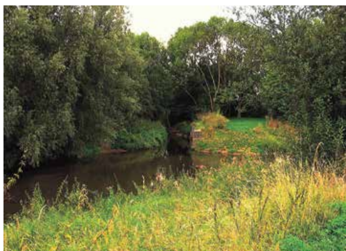
Mündung des Eschbachs in die Nidda bei Frankfurt-Harheim.

Ein Naturparadies inmitten der Stadt. Am östlichen Rand des Stadtteils, nahe der Grenze zu Bad Vilbel, erstreckt sich dieses