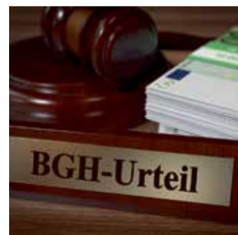
Starkes Urteil für Versicherte.

Bei einem Widerruf erhalten Sie – anders als bei der Kündigung – alle eingezahlten Beiträge ohne Abzug von Maklerprovisionen und Verwaltungskosten zurück. Und nicht nur das: Die Versicherung muss Sie auch an dem mit Ihrem Geld erzielten Anlagegewinn beteiligen. So können Sie bis zu 150 % der eingezahlten Beiträge zurückholen. Ein sattes Plus auf Ihrem Konto winkt!