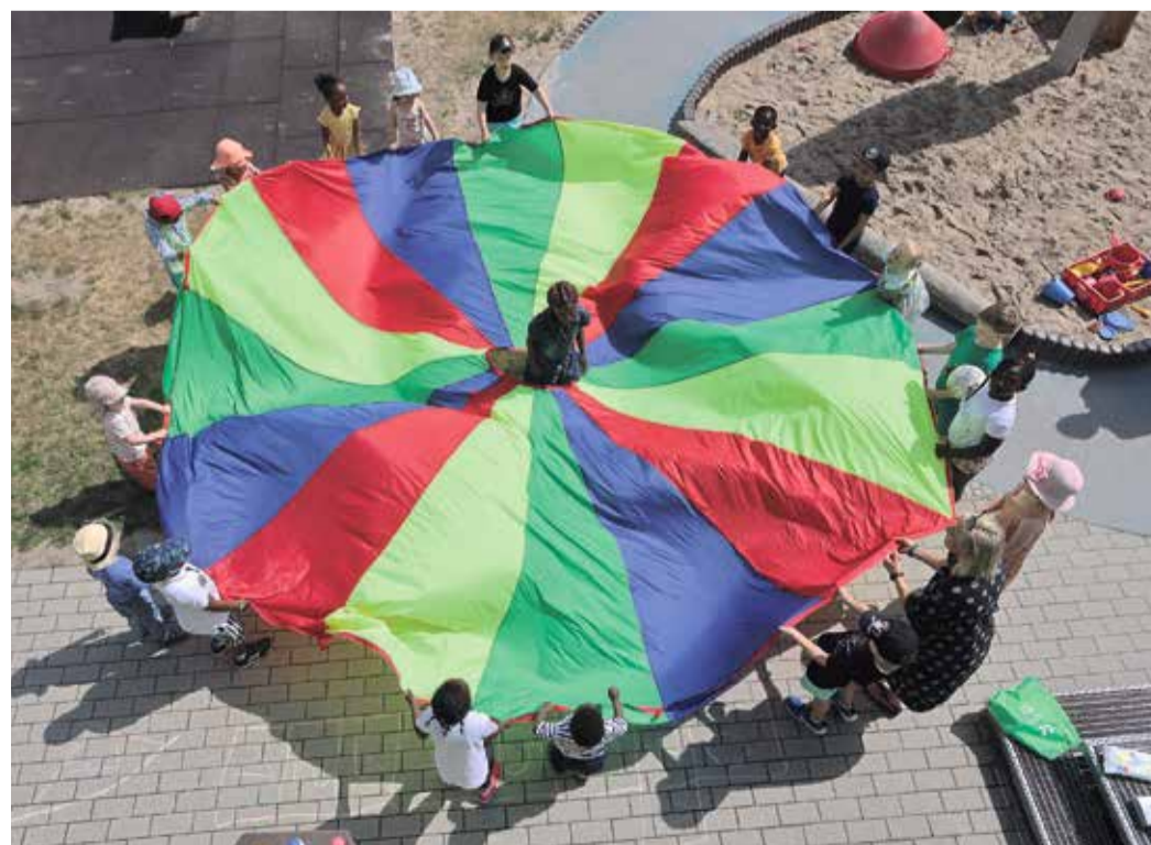
Teilnehmende Kinder am Programm „Frankfurt zaubert“.

„Frankfurt zaubert“ wurde 2021 mit dem Ziel initiiert, kurzfristig ein Maßnahmenpaket nach den coronabedingten Einschränkungen zu schnüren, um die Frankfurter Kinder und Jugendlichen zu stärken und die pädagogischen Fach- und Führungskräfte durch spezifische Angebote in ihrem Alltag zu unterstützen.