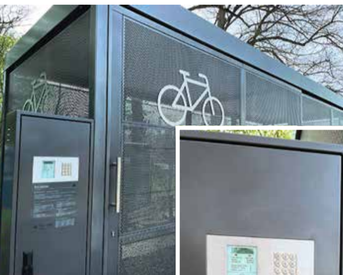
Der Fahrradsafe ist optisch gut integriert.