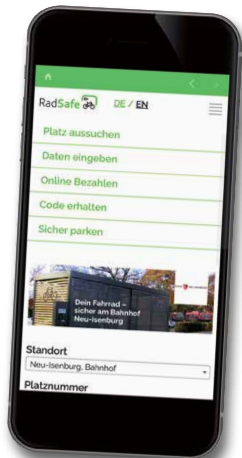
Einfach die Rad Safe App im Appstore herunterladen und loslegen.

ist per PayPal, Kreditkarte oder SEPA-Lastschrift möglich. Das Fahrrad wird in einem Doppelstockparker abgestellt. Die Plätze sind frei wählbar. Es können Fahrräder in allen Rahmengrößen bis 28 Zoll mit