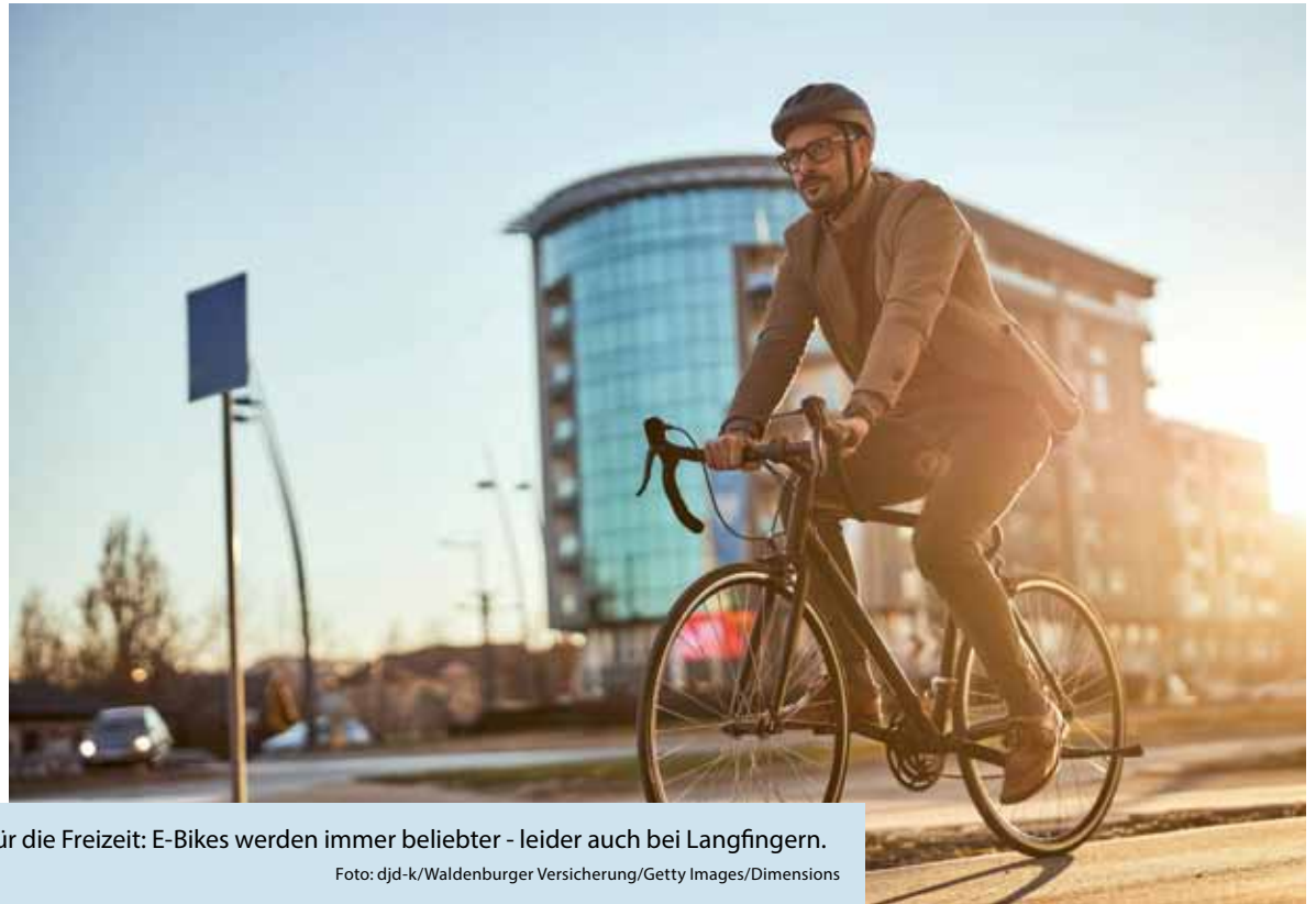
Für den Weg zum Arbeitsplatz oder für die Freizeit: E-Bikes werden immer beliebter - leider auch bei Langfingern.