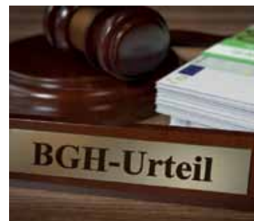
Starkes Urteil für Versicherte.

Bei einem Widerruf erhalten Sie – anders als bei der Kündigung – alle eingezahlten Beiträge ohne Abzug von Maklerprovisionen und Verwaltungskosten zurück. Und nicht nur das: Die Versicherung muss Sie auch an dem mit Ihrem Geld erzielten Anlagegewinn beteiligen. So können Sie bis zu 150 % der eingezahlten Beiträge zurückholen. Ein sattes Plus auf Ihrem Konto winkt!