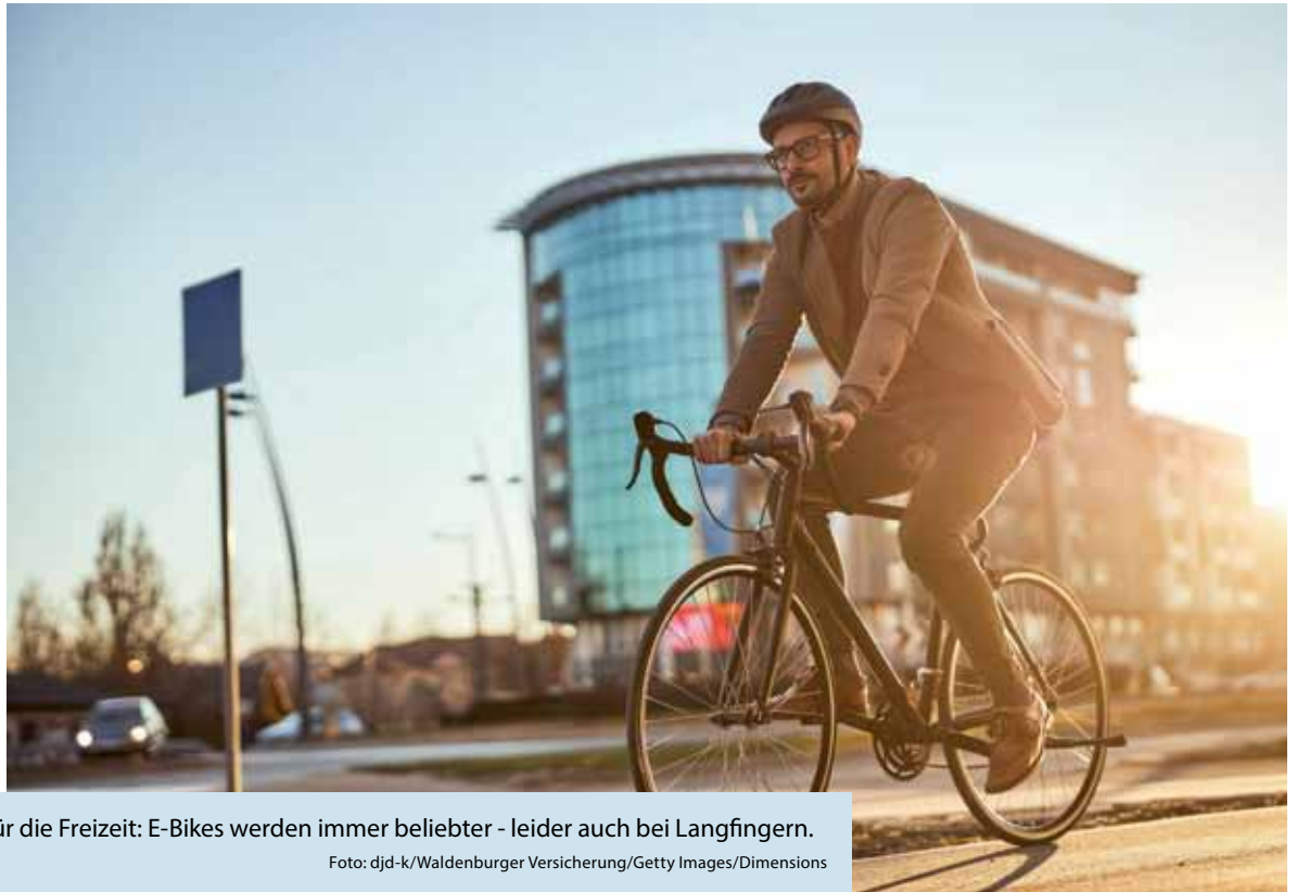
Für den Weg zum Arbeitsplatz oder für die Freizeit: E-Bikes werden immer beliebter - leider auch bei Langfingern.