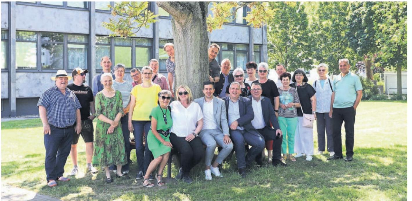
In Freundschaft vereint: Die Delegation aus dem Rathaus Laakirchen gemeinsam mit den Vertreterinnen und Vertretern des Obertshausener Magistrats – im schattigen Plätzchen auf der Jubiläumsbank und rundherum.

Präsident der Verschwisterung steht am Rathaus Schubertstraße