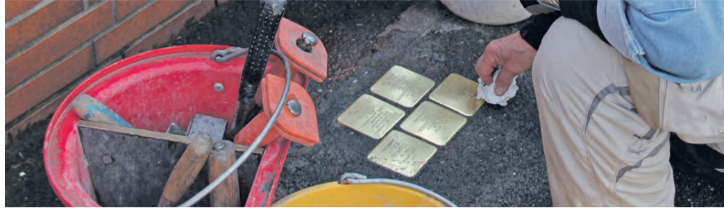
So glänzend sahen die Stolpersteine aus, die der Kölner Künstler Gunter Demnig im März 2019 in der Wilhelm-Leuschner-Straße verlegte.

ERFELDEN – Im Oktober 2019 hatte der Kölner Künstler Gunter Demnig die letzten sieben Stolpersteine in Erinnerung an die Opfer des Nationalsozialismus in Erfelden verlegt.