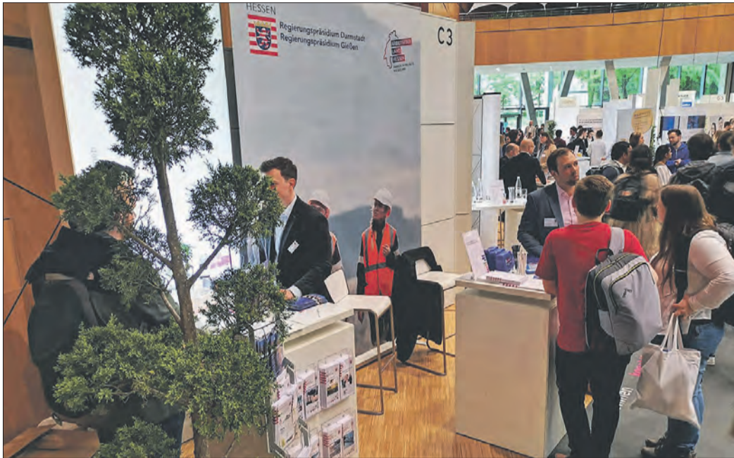
RP-MITARBEITER IM GESPRÄCH mit Studierenden bei der kontakta in Darmstadt.

RP weist auf gesellschaftliche Bedeutung hin