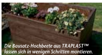
Die Bausatz-Hochbeete aus TRAPLAST™ lassen sich in wenigen Schritten montieren.

den Ton angibt. Auch in die Küchenplanung hat „Vulkangrau“ Einzug gehalten: Küchenspezialist Blanco bietet ein großes Portfolio an Spülen und Becken aus „Silgranit“ sowie Armaturen im „Silgranit“-Look nun in dem neuen Trendfarbton an. Die „Silgranit“-Oberflächen in „Vulkangrau“ besitzen eine leichte Textur für einen natürlichen Look und eine angenehme Haptik. Feine Nuancen von Braun, kaum sichtbar und doch präsent in ihrer Wirkung, fügen dem edlen Grauton eine feine Note „erdiger“ Harmonie hinzu. Das elegante Grau passt zu einer breiten Palette an Küchenstilen, von modern über Industrial Style bis hin zu jungem Landhausstil. Mehr unter www.homeplaza.de/blanco