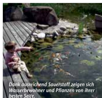
Dank ausreichend Sauerstoff zeigen sich Wasserbewohner und Pflanzen von ihrer besten Seite.

(epr) Sommer, Sonne, Algenzeit – für Teichbesitzer bringen die warmen Monate eine besondere Herausforderung mit sich. Denn durch freigesetzte Nährstoffe und die verlängerte Sonneneinstrahlung vermehren sich verschiedene Algenarten explosionsartig. Für einen ungetrübten Blick auf fidele Fische empfiehlt sich ein zuverlässiges System, das ein optimales biologisches Gleichgewicht im Wasser schafft. Im Vergleich zu herkömmlichen Belüftungsanlagen