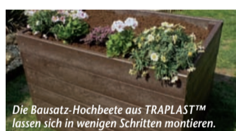
Die Bausatz-Hochbeete aus TRAPLAST™ lassen sich in wenigen Schritten montieren.

den Ton angibt. Auch in die Küchenplanung hat „Vulkangrau“ Einzug gehalten: Küchenspezialist Blanco bietet ein großes Portfolio an Spülen und Becken aus „Silgranit“ sowie Armaturen im „Silgranit“-Look nun in dem neuen Trendfarbton an. Die „Silgranit“-Oberflächen in „Vulkangrau“ besitzen eine leichte Textur für einen natürlichen Look und eine angenehme Haptik. Feine Nuancen von Braun, kaum sichtbar und doch präsent in ihrer Wirkung, fügen dem edlen Grauton eine feine Note „erdiger“ Harmonie hinzu. Das elegante Grau passt zu einer breiten Palette an Küchenstilen, von modern über Industrial Style bis hin zu jungem Landhausstil. Mehr unter www.homeplaza.de/blanco