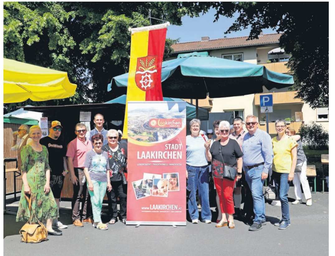
Zum gemeinsamen Erinnerungsfoto ging es auf die Rathaus-Treppe – der Magistrat der Stadt Obertshausen zusammen mit der Delegation aus Laakirchen.