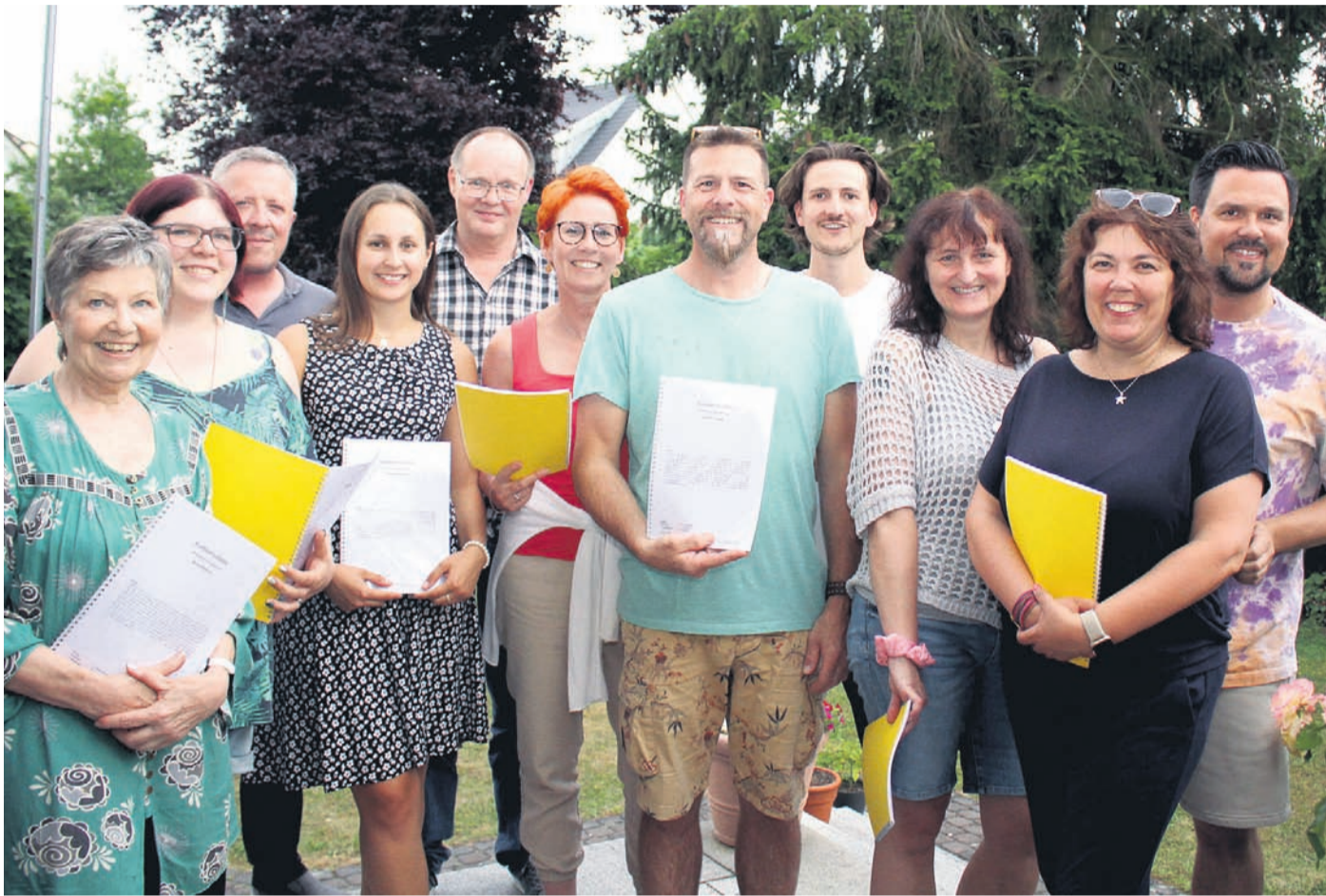
Die Aktiven des Theaterclub LACHMAL bei der ersten Probe. Am 21., 27. und 28. Oktober 2023 heißt es in der Obertshäuser Mehrzweckhalle „Entführt/Verführt“.