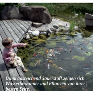
Dank ausreichend Sauerstoff zeigen sich Wasserbewohner und Pflanzen von ihrer besten Seite.

Frischekick für Fische – Praktischer Oxydator versorgt Wasserbewohner mit Sauerstoff (epr) Sommer, Sonne, Algenzeit – für Teichbesitzer bringen die warmen Monate eine besondere Herausforderung mit sich. Denn durch freigesetzte Nährstoffe und die verlängerte Sonneneinstrahlung vermehren sich verschiedene Algenarten explosionsartig. Für einen ungetrübten Blick auf fidele Fische empfiehlt sich ein zuverlässiges System, das ein optimales biologisches Gleichgewicht im Wasser schafft. Im Vergleich zu herkömmlichen Belüftungsanlagen