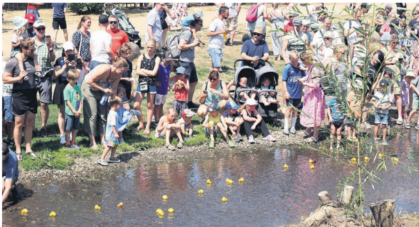
Am Rodauufer herrschte beim Entenrennen Hochbetrieb.

„Das Entenrennen ist immer ein wunderbares Fest.“ Seitdem