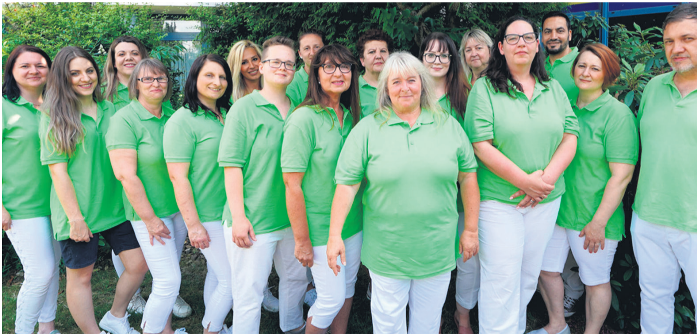
Ein kompetentes Team: CareKomm.

Die Verantwortlichen für den Kinderchor haben sich schon die nächsten Ziele gesetzt, u.a. eine Halloween-Show im Oktober und im neuen Jahr ein weiteres größeres Musikprojekt, neben Auftritten in der Weihnachtszeit.--Anzeige