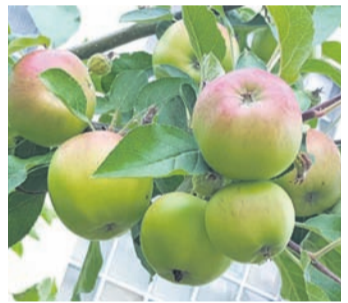
Wenn Obstbäume Früchte tragen sollen, müssen sie gepflegt werden. Dabei hilft die StreuObstCoOp

großzügig bezuschusst, die Eigenbeteiligung der Bestellen den beträgt 1,00 € pro Baum. Voraussetzung für die Lieferung ist, dass das vorgesehene Gelände für eine Streuobstwiese geeignet ist. Ob dies der Fall ist entscheidet die untere Naturschutz Behörde (UNB) des Landkreises Offenbach. Das Schnitt- und Pflegeseminar wird voraussichtlich am 7.10.2023 im Vereinsheim des Wanderclub Edelweiß stattfinden. Der praktische Teil findet im Freien auf einer Streuobstwiese statt. Anmeldungen werden ab sofort per E-Mail an streuobstcoop@in-dudenhofen.de entgegengenommen. Es können maximal 20 Personen teilnehmen. Die Durchführung der Veranstaltung kann sich kurzfristig ändern. Die Anmeldungen werden in der Reihenfolge ihres Eingangs berücksichtigt. Nähere Informationen an die Teilnehmenden folgen später. Aus persönlichen Gründen wird Steffen Freund Ende die