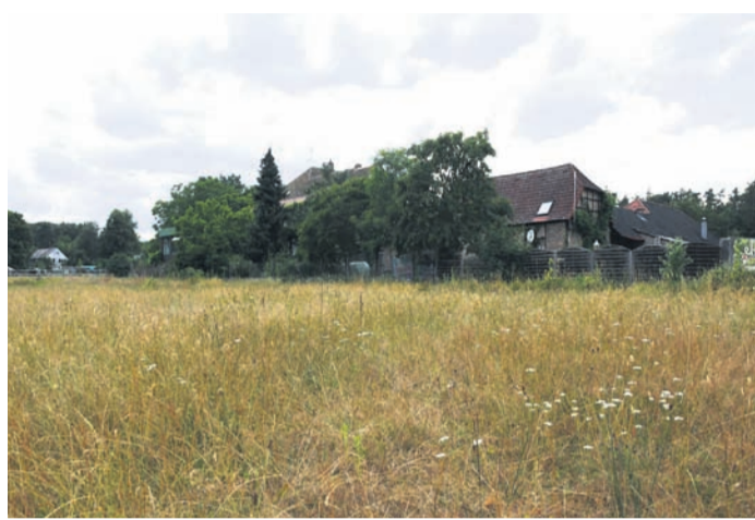
Auf der „Merck-Wiese“ nahe Eppertshausen soll ein riesiger Solarpark entstehen. Das Foto zeigt den westlichsten Zipfel der Fläche mit einem Teil des Gutshofs Thomashütte im Hintergrund.

Eppertshausen (jedö) Schon in zwei Jahren könnten alle Eppertshäuser Haushalte mit Solarstrom versorgt werden, der direkt vor ihrer Tür erzeugt wird: Die Gemeindevertreter haben am Mittwochabend einstimmig den Bau einer riesigen Photovoltaik-Anlage auf der „Merck-Wiese“ zwischen dem Gutshof Thomashütte und dem Rallenteich befürwortet. Zugleich ebneten sie dem Großprojekt mit einem wichtigen Beschluss den Weg. Auf neun Hektar könnte bis 2025 ein Solarpark entstehen, in den die Greenovative GmbH aus Nürnberg 7,5 Millionen Euro investieren will und dessen Leistung für die Stromversorgung sämtlicher 2 700 Haushalte in Eppertshausen reichen würde. Der fränkische Investor, der ähnliche Projekte bereits realisiert hat, hält die 91 454 Quadratmeter unter anderem deswegen für eine Freiflächen-PV-Anlage geeignet, weil in der Nähe eine (von e-Netz Südhessen betriebene) Mittelspannungsleitung existiert. Zudem liegt die Fläche außerhalb von Schutzgebieten, besteht größtenteils aus einer