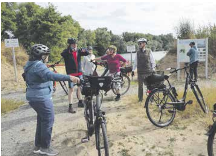
Informativer Zwischenstopp an der Kiesgrube.

Unterwegs konnten Störche, Graureiher und sogar ein Reh gesichtet werden. Über Dornheim, Wolfskehlen und Goddelau kamen die OWKler bei Sonnenschein in Crumstadt an. Hier hatten die Goddelauer OWK-Freunde ihre Grillstation geöffnet und es konnte nach Herzenslust geschlemmt werden und natürlich wurde auch mit vielen befreundeten OWKlern geplauscht. Ein Kurzstopp in der Eisdiele Goddelau auf der Heimfahrt musste aber sein. Danach führte die Strecke am Weilerhof vorbei. Wieder zu Hause angekommen, hatten die 21 Radler bis Groß-Gerau 40 km und bis Nauheim sogar 50 km zurückgelegt.