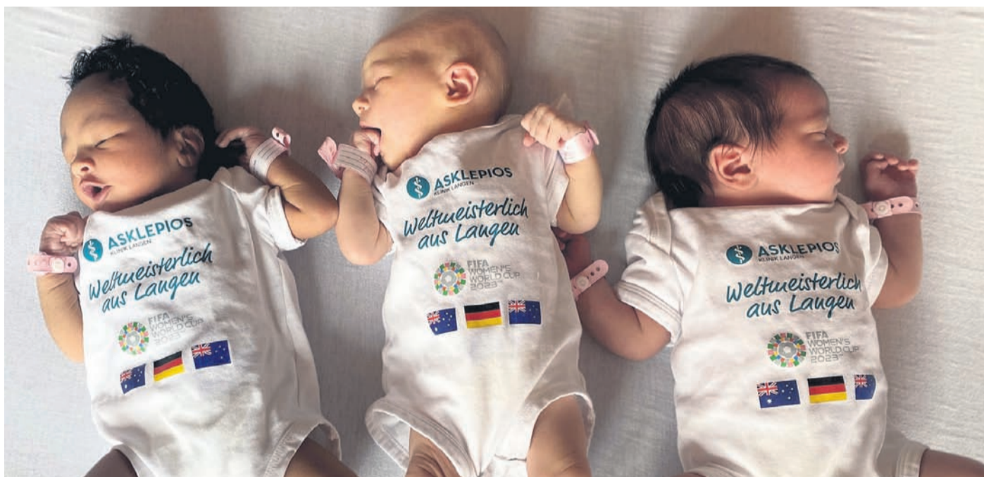
Das Foto zeigt Babys, die am 11. Juni in Langen geboren wurden.