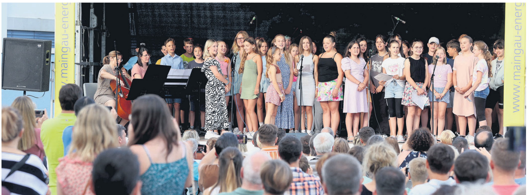
Der Chor der fünften Klassen sang „We are the world“.