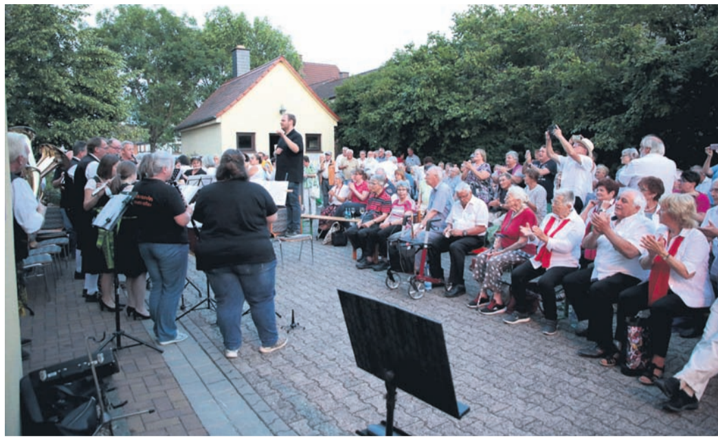
Einen sehr unterhaltsamen Abend verbrachten die zahlreichen Besucher am Backes.

Lieder wie „Du passt so gut zu mir“, „Ich wollt, ich wär ein Huhn“ und „Mein kleiner grüner Kaktus“ gehörten einst zum Repertoire der „Comedian Harmonists“, deren Gesangsstil vom amerikanischen Bar-