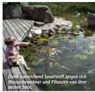
Dank ausreichend Sauerstoff zeigen sich Wasserbewohner und Pflanzen von ihrer besten Seite.

Frischekick für Fische – Praktischer Oxydator versorgt Wasserbewohner mit Sauerstoff (epr) Sommer, Sonne, Algenzeit – für Teichbesitzer bringen die warmen Monate eine besondere Herausforderung mit sich. Denn durch freigesetzte Nährstoffe und die verlängerte Sonneneinstrahlung vermehren sich verschiedene Algenarten explosionsartig. Für einen ungetrübten Blick auf fidele Fische empfiehlt sich ein zuverlässiges System, das ein optimales biologisches Gleichgewicht im Wasser schafft. Im Vergleich zu herkömmlichen Belüftungsanlagen