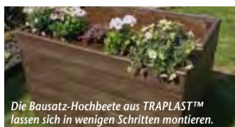
Die Bausatz-Hochbeete aus TRAPLAST™ lassen sich in wenigen Schritten montieren.

den Ton angibt. Auch in die Küchenplanung hat „Vulkangrau“ Einzug gehalten: Küchenspezialist Blanco bietet ein großes Portfolio an Spülen und Becken aus „Silgranit“ sowie Armaturen im „Silgranit“-Look nun in dem neuen Trendfarbton an. Die „Silgranit“-Oberflächen in „Vulkangrau“ besitzen eine leichte Textur für einen natürlichen Look und eine angenehme Haptik. Feine Nuancen von Braun, kaum sichtbar und doch präsent in ihrer Wirkung, fügen dem edlen Grauton eine feine Note „erdiger“ Harmonie hinzu. Das elegante Grau passt zu einer breiten Palette an Küchenstilen, von modern über Industrial Style bis hin zu jungem Landhausstil. Mehr unter www.homeplaza.de/blanco