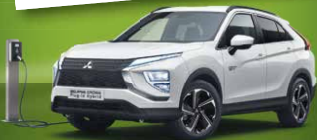
Der Eclipse Cross Plug-in Hybrid

Eclipse Cross Plug-in Hybrid PLUS Verschiedene Farben, Händlerzulassung: z.B. EZ Dezember 2022, 25 km, UPE Neufahrzeug 44.190 EUR 2 Unser Hauspreis ab 33.990 EUR 3 Eclipse Cross Plug-in Hybrid PLUS 4WD 2.4 Benziner 72 kW (98 PS), Elektromotoren vorn 60 kW (82 PS)/ hinten 70 kW (95 PS), Systemleistung 138 kW (188 PS)