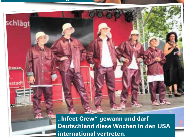
„Infect Crew“ gewann und darf Deutschland diese Wochen in den USA international vertreten.