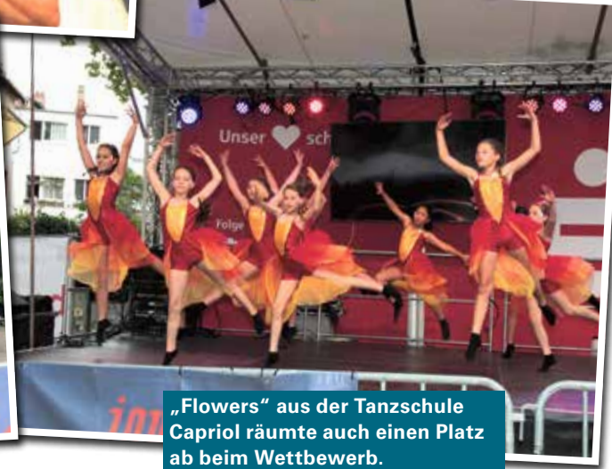
„Flowers“ aus der Tanzschule Capriol räumte auch einen Platz ab beim Wettbewerb.