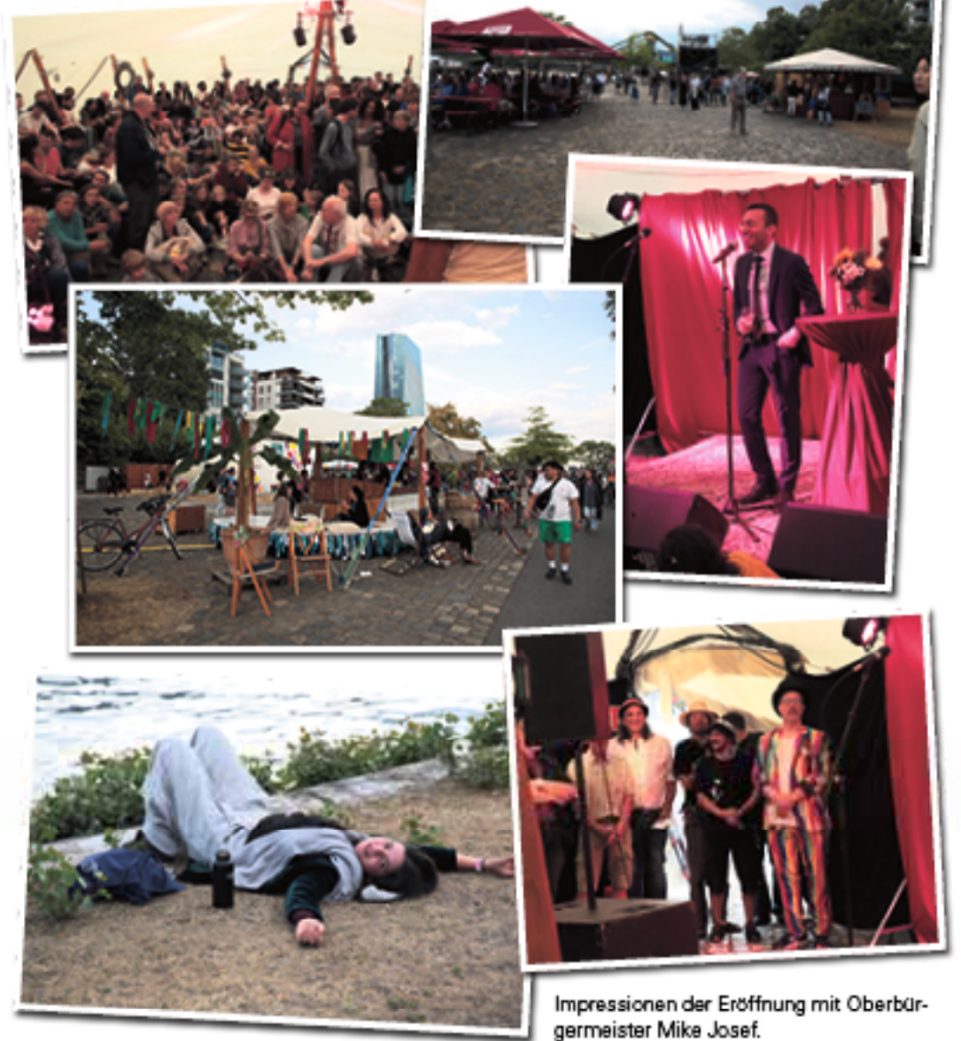
Impressionen der Eröffnung mit Oberbürgermeister Mike Josef.