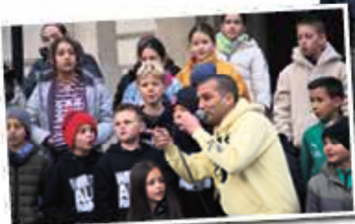
Kinderchor Aktion Alte Oper.

sendet eine Veröffentlichungsfreigabe für eure Erziehungsrechtlichen und den Songtext – sofern der Text überhaupt noch nötig ist. Zur Einstimmung: Der WSAF Kinderchor an der Alten Oper https://www.youtube.com/watch?v=NbdzEFiQmCo