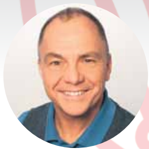
Udo Klein Schwebewerk