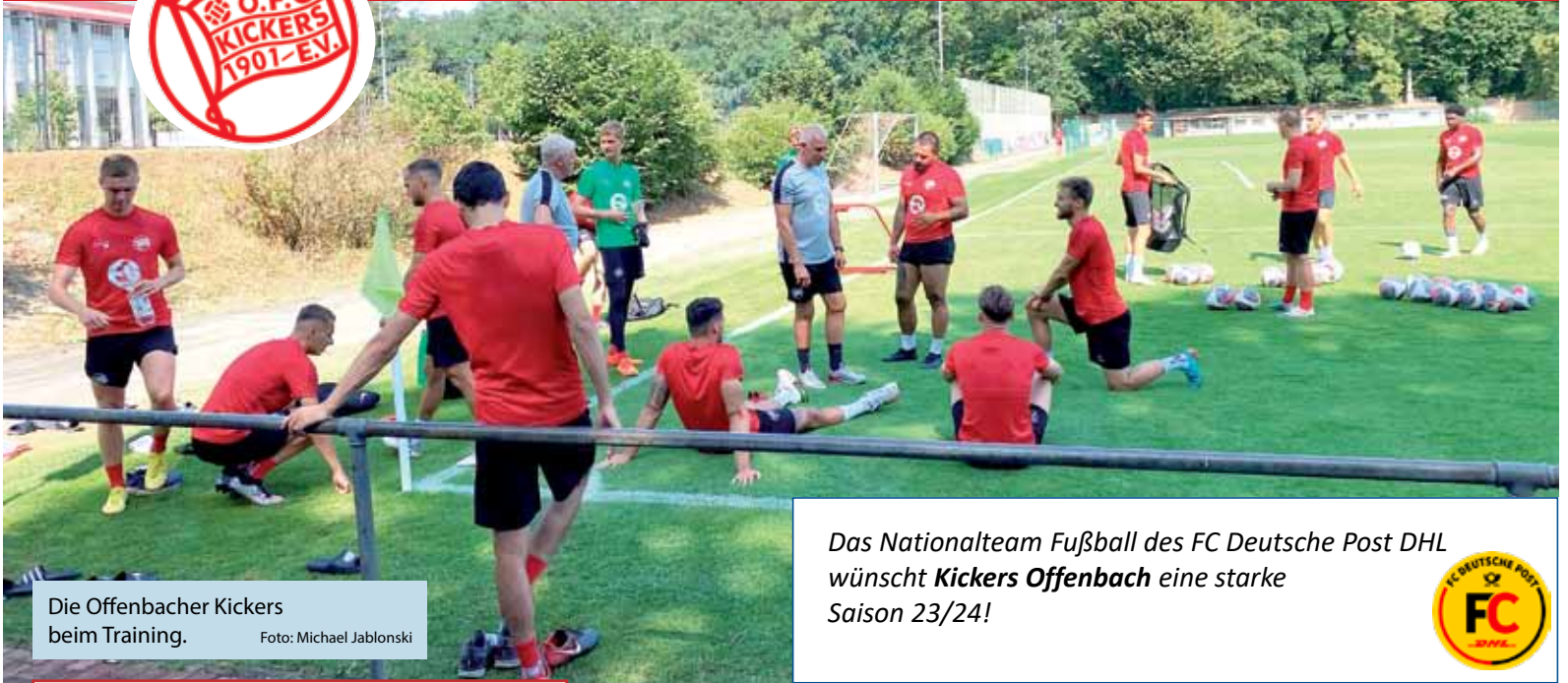
Die Offenbacher Kickers beim Training.

Das Nationalteam Fußball des FC Deutsche Post DHL wünscht Kickers Offenbach eine starke Saison 23/24!