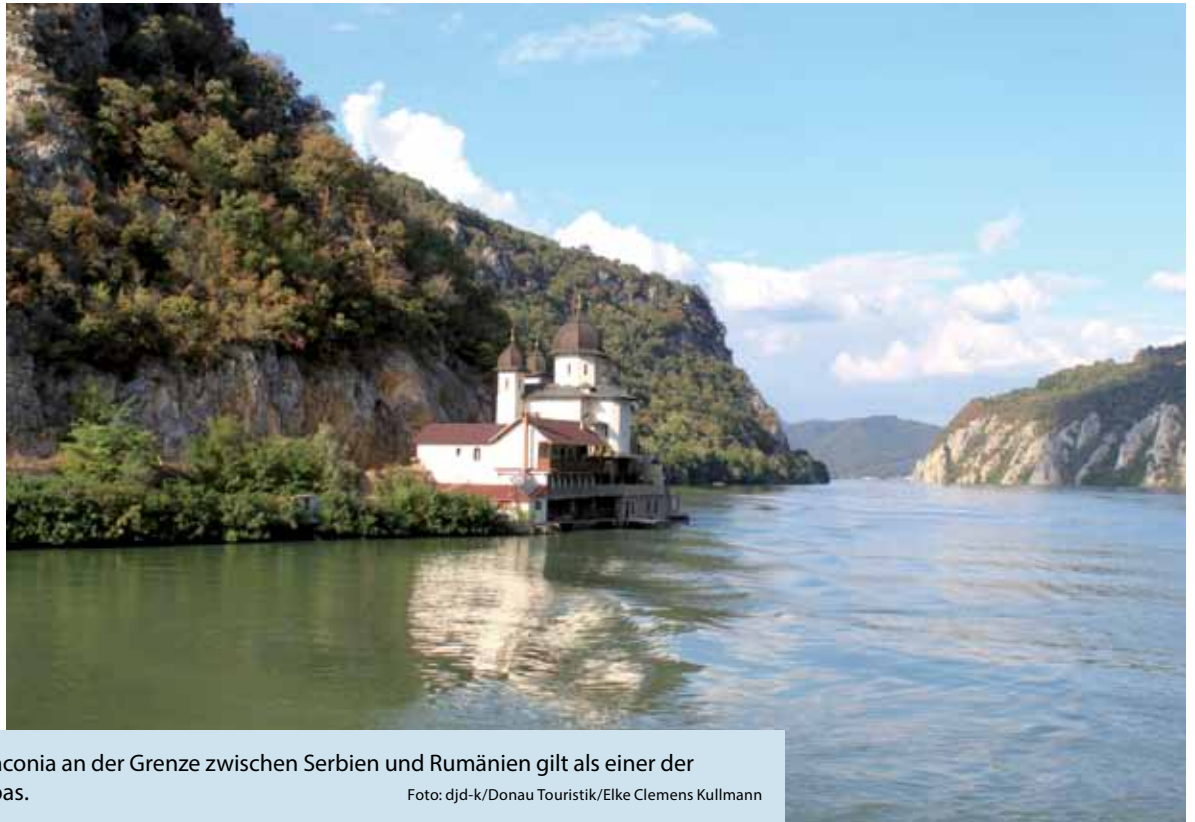
Das „Eiserne Tor“ mit dem Kloster Mraconia an der Grenze zwischen Serbien und Rumänien gilt als einer der imposantesten Taldurchbrüche Europas.

(DJD-K). Radkreuzfahrten sind die ideale Kombination aus gesunder Bewegung an der frischen Luft und Entspannung an Bord. Das Schiff ist ein schwimmendes Hotel - die Gäste müssen nur einmal einchecken, das Gepäck bleibt an Bord. Vom Anbieter Donau Touristik beispielsweise gibt es eine 13-tägige Radkreuzfahrt auf der MS Primadonna mit 82 Kabinen von Passau bis zum „Eisernen Tor“ an der Grenze von Serbien und Rumänien und zurück nach Passau. Für bleibende Eindrücke sorgen das UNESCO-Welterbe Wachau, fünf Nationalparks, das Donauknie, der Silbersee in Serbien, zahlreiche Burgen und die Donaustädte Wien, Bratislava, Budapest und Belgrad. Infos gibt es unter www.donaureisen.at/flusskreuzfahrten . Die Reise wird vom 29. September bis 11. Oktober 2023 angeboten, einen weiteren Termin gibt es im Mai.