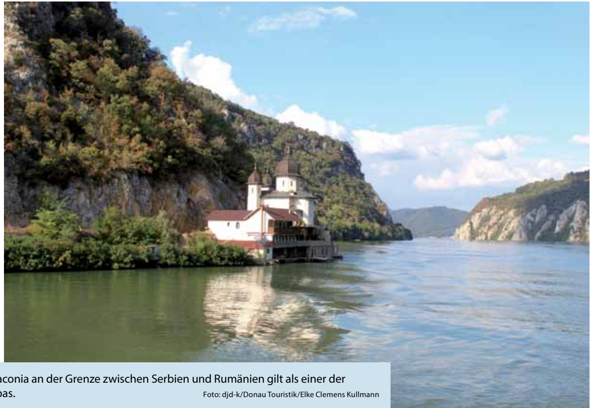
Das „Eiserne Tor“ mit dem Kloster Mraconia an der Grenze zwischen Serbien und Rumänien gilt als einer der imposantesten Taldurchbrüche Europas.

(DJD-K). Radkreuzfahrten sind die ideale Kombination aus gesunder Bewegung an der frischen Luft und Entspannung an Bord. Das Schiff ist ein schwimmendes Hotel - die Gäste müssen nur einmal einchecken, das Gepäck bleibt an Bord. Vom Anbieter Donau Touristik beispielsweise gibt es eine 13-tägige Radkreuzfahrt auf der MS Primadonna mit 82 Kabinen von Passau bis zum „Eisernen Tor“ an der Grenze von Serbien und Rumänien und zurück nach Passau. Für bleibende Eindrücke sorgen das UNESCO-Welterbe Wachau, fünf Nationalparks, das Donauknie, der Silbersee in Serbien, zahlreiche Burgen und die Donaustädte Wien, Bratislava, Budapest und Belgrad. Infos gibt es unter www.donaureisen.at/flusskreuzfahrten . Die Reise wird vom 29. September bis 11. Oktober 2023 angeboten, einen weiteren Termin gibt es im Mai.