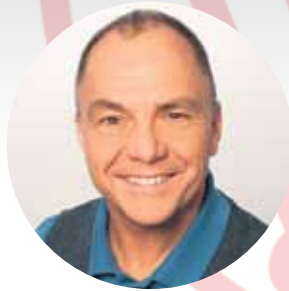
Udo Klein Schwebewerk