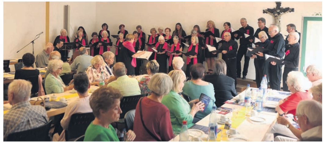
Das Vokalensemble eröffnete das Konzert.

Verschiedene Vorlagen finden Sie auch auf unserer Homepage unter www.heimat-zeitungen.de/ familienanzeigen