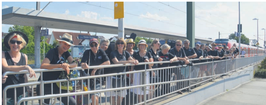
Endlich Musigg bei seiner Ankunft in Ober-Roden.

Ober-Roden (NHR) Was haben das Endlich Musigg Orchester und die S-Bahn gemeinsam? Sie verbinden Menschen! Beheimatet ist Endlich Musigg in Ober-Roden, die Musigger kommen aus der gesamten Region: Rödermark, Darmstadt, Frankfurt, Groß-Umstadt, Hanau, Offenbach und natürlich aus dem Rodgau. Sie alle verbindet die Liebe zum gemeinsamen Musizieren und das „Mehr als Musik“.