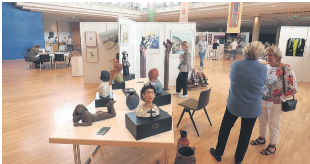
Mit einer vielfältigen Abschiedsausstellung präsentierte sich KiR in der Kulturhalle.