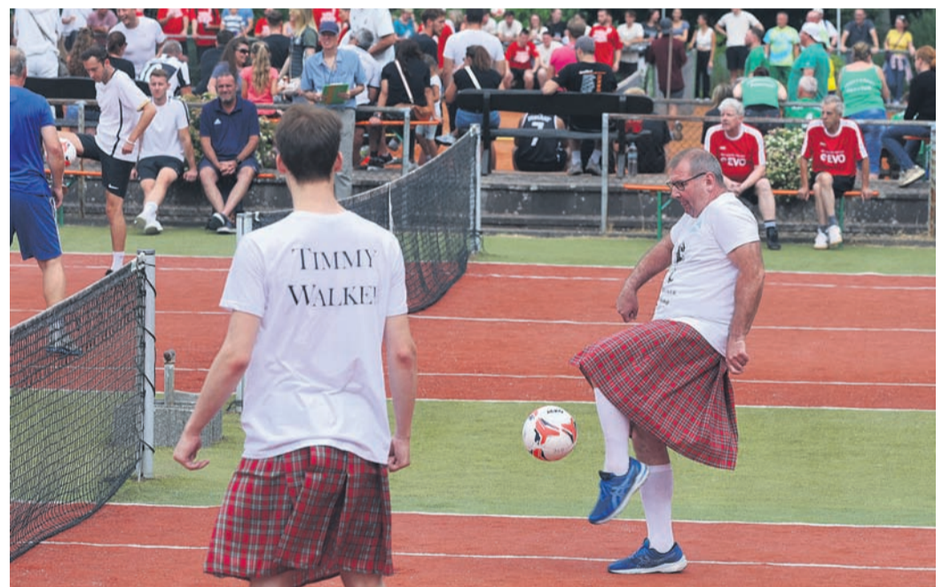
29 Teams waren beim Fußballturnier am Start.