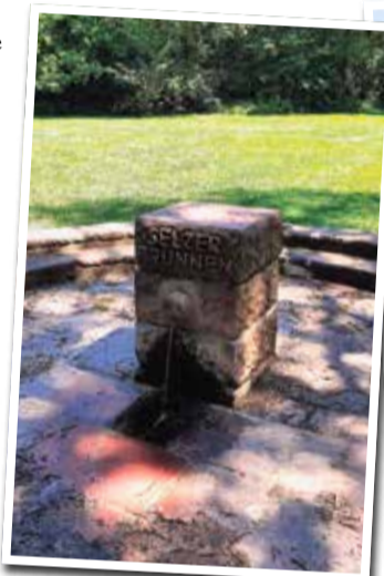
Der Selzerbrunnen im Niedwald.

Der Niedwald, ein ehemaliger Auwald von 60 Hektar Größe, begeistert mit seiner reichen Tier- und Pflanzenvielfalt. Entlang des Südufers der Nidda gelegen, ist der natürliche Be-