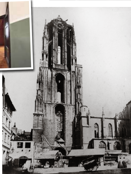
Türmerstube Dom nach dem Brand 1867.