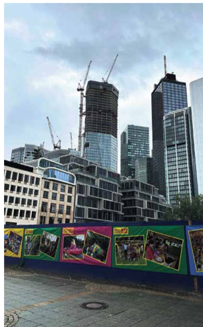
Fotoausstellung der Kinderfreude.

den aktuell laufenden Ferienspielaktionen Mainspiele und Opernspiele. Die Ausstellung, für welche die Grundstückseigentümerin „Signa“ deren Bauzaun dem Verein kostenlos zur Verfügung gestellt hat, ist über die Monate August und September des Jahres zu bewundern. Die Ausstellung gibt einen eindrucksvollen Einblick in die langjährige Arbeit des für Frankfurt so wichtigen Vereins im 50. Jahr seines Bestehens. Das 50jährige Jubiläum wird am 09. April 2024 gefeiert.