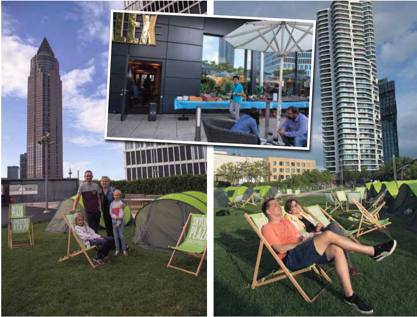
Familie Draisbach aus Rüsselsheim.