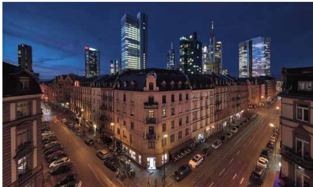
Bilder von den schönen Seiten des Bahnhofsviertel sucht der Gewerbeverein Bahnhofsviertel in seinem Fotowettbewerb „Auf-ins-Viertel“ mit Ausstellung (Bildermotive Alim Fisch, „Belvedere“ Kaiserstraße, Skylineblick Münchener/ Ecke Elbestraße Straße).