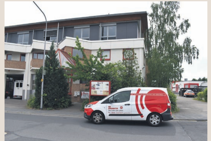
Die Johanniter-Unfallhilfe in Nieder-Roden: Das Gebäude ist mit Qualitäts-Fenstern mit Wärmeschutzglas ausgestattet.

Für viele Bauherren ist es nur mit großem Aufwand möglich, umfassende Auskünfte über Förderungsgelder bei Renovierungsarbeiten zu bekommen. Um diese Auskünfte und Anträge kümmert sich bei Sommer Fenster ein staatlich anerkannter Energieberater mit einem speziellen Sonderpreis. Vereinbaren Sie einen Gesprächstermin. Fenster Sommer: Tel.: 0 6 1 0 6 / 7 3 3 2 4 4, 0 1 7 1 / 6 5 1 2 4 4 0, www.fenster-sommer.de; fenster-sommer@gmx.de