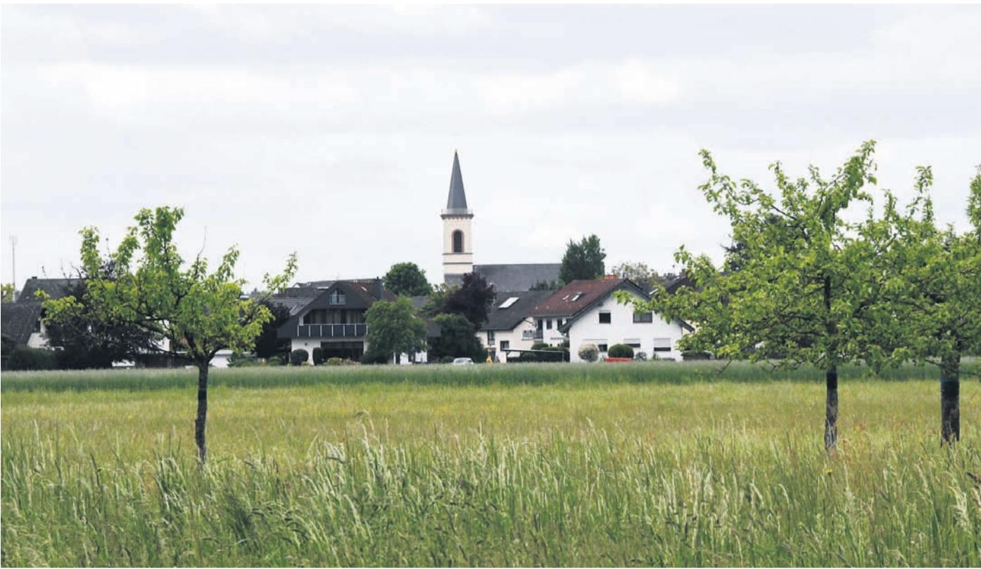
Auf sieben Hektar südlich der Babenhäuser Straße könnte in Eppertshausen ein weiteres Wohngebiet entstehen. Ein „Zukunftsplan“ soll auch dazu viele Fragen klären. Im Herbst könnte er beauftragt werden, die Ergebnisse 2024 vorliegen. In der Bildmitte hinten: der Turm der Kirche St. Sebastian.