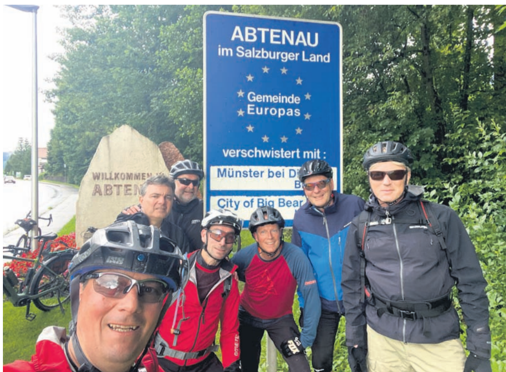
Die Radler sind in Abtenau angekommen.

auch eine gewisse Popularität im Ort genoss. Wiederholt vernahm man nämlich die Frage: „Seid's ihr die Radfahrer?“ Es hatte sich im Ort, nicht zuletzt über soziale Medien, herumgesprochen, dass da gerade eine ganz besondere Gruppe aus der Partnergemeinde in Abtenau verweilte, deren erbrachter Leistung man mit höchster Anerkennung begegnete. Abschließend kann man festhalten, dass man sich in Abtenau sehr wohl gefühlt und mit der Reise der Städtepartnerschaft zwischen Münster und Abtenau offenbar einen großen Dienst erwiesen hat. Man war bestimmt nicht zum letzten Mal dort!