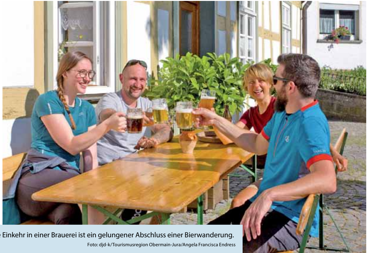
Erst die Bewegung, dann das Bier. Die Einkehr in einer Brauerei ist ein gelungener Abschluss einer Bierwanderung.

(DJD-K). Barocke Baudenkmäler wie Kloster Banz oder die Basilika Vierzehnheiligen und die felsige Topografie machen die Region Obermain-Jura zu einem besonderen Flecken Erde. Und eine weitere Facette prägt Land und Leute: das Bier. Dem Gerstensaft begegnet man hier auf Schritt und Tritt. Meist sind es kleine Betriebe, die sich der Herstellung widmen, die Vielfalt an Geschmack und Sorten ist groß. Eine Brauereiwanderung führt durch die Täler von Main, Lauter oder Itz und auf die Höhen von Staffelberg und Co. - in Verbindung mit so manchem Brauereibesuch. Wer von allen elf Brauereien in Bad Staffelstein einen Stempel erhalten hat, darf sich sein Bierdiplom abholen. Brauereitourne gibt es aber auch für Radler, man findet sie unter www.bad-staffelstein.de oder auf dem Routenplaner-Portal Komoot.