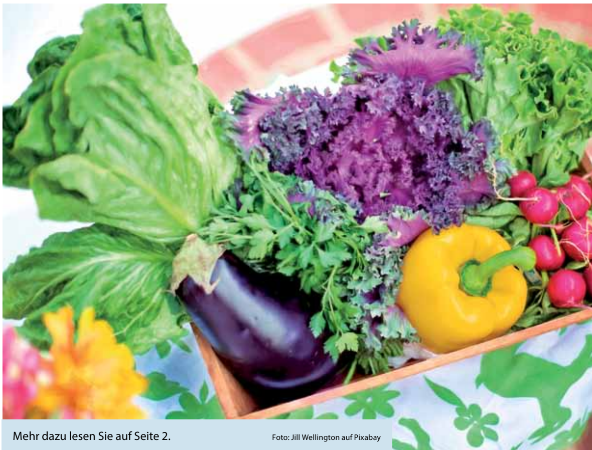
Mehr dazu lesen Sie auf Seite 2.