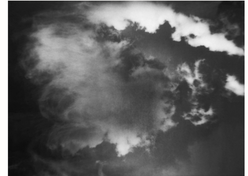
Bevor sich die Polizei auf die Suche nach einem unbekanntem Täter begibt, bildet sie das Gesicht des Unbekannten auf einem Phantombild ab. Gerhard Lang verwendet in seiner Arbeit seit 1991 ein altes Phantombildgerät des Bundeskriminalamtes (BKA) in Wiesbaden. Das Gerät verfügt über eine besondere Spiegeltechnik, mit der Bildteile von bis zu vier passbildgroßen Vorlagen zu einem neuen Ganzen, einem Phantombild, zusammengesetzt werden können. Beide Bilder entstanden mit dem Phantombildgerät. Links: Unbekannt, Palaeanthropische Physiognomie , 1992. Rechts und Cover: Nubeologisches Phantom , 2012