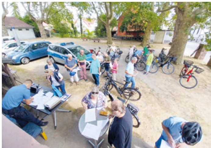
Großer Andrang bei der Fahrradcodieraktion bei den DRK Aktiven Senioren Wixhausen.

(rb) Am Donnerstag, 20. Juli 2023, führten Beamte des 3. Polizeireviers in der Zeit von 15–17 Uhr parallel zum Repa-